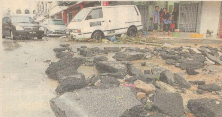
MACAM LAUT... pusat bandar Kajang dilanda bah. TERKOPAK... jalan raya dirosakkan air banjir.