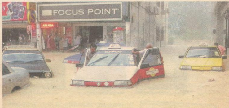
ROSAK... banyak premis perniagaan kerugian. TOLAK... seorang drebar cuba menyelamatkan teksinya.