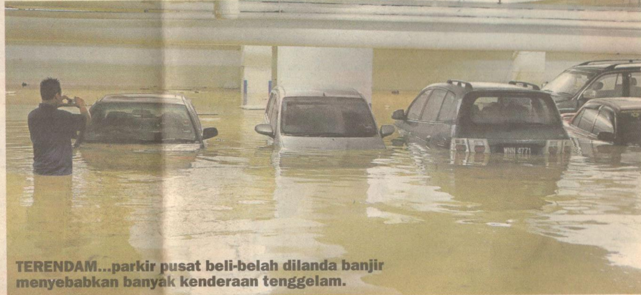
TERENDAM...parkir pusat beli-belah dilanda banjir menyebabkan banyak kenderaan tenggelam.

Katanya, berdasarkan maklumat penduduk Kampung Jalan Kelapa, kejadian banjir semalam terburuk sejak 40 tahun lalu di mana 12 buah rumah di situ tenggelam sepenuhnya.