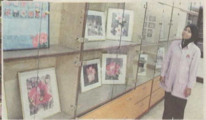
GALERI yang menyimpan gambar-gambar bunga raya yang terdapat di Taman Bunga Raya, Taman Tasik Perdana.

“Selain itu, sifatnya yang memiliki lima kelopak dikaitkan dengan lima prinsip Rukun Negara manakala kepelbagaian bunga raya dari segi bentuk, warna dan ukurannya melambangkan rakyat pelbagai kaum, agama dan budaya yang hidup dalam harmoni,” jelasnya.