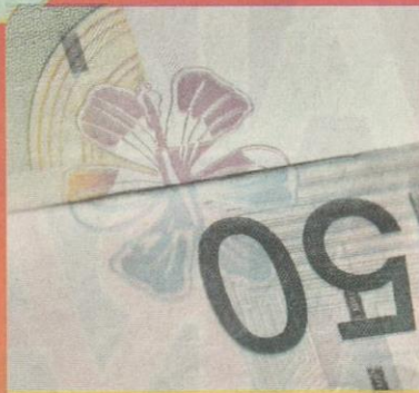
WANG kertas Malaysia mempunyai lambang bunga raya.

Proses memilih dan menentukan bunga kebangsaan adalah satu perkara sukar kerana bunga dipilih perlu berdasarkan cita rasa seluruh rakyat dan falsafah yang mendasari kewujudan sesebuah negara.