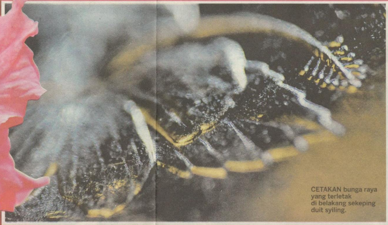
CETAKAN bunga raya yang terletak di belakang sekeping duit syiling.