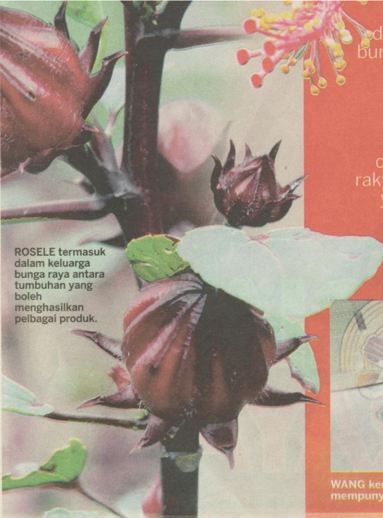
ROSELE termasuk dalam keluarga bunga raya antara tumbuhan yang boleh menghasilkan pelbagai produk.

Proses memilih dan menentukan bunga kebangsaan adalah satu perkara sukar kerana bunga dipilih perlu berdasarkan cita rasa seluruh rakyat dan falsafah yang mendasari kewujudan sesebuah negara.