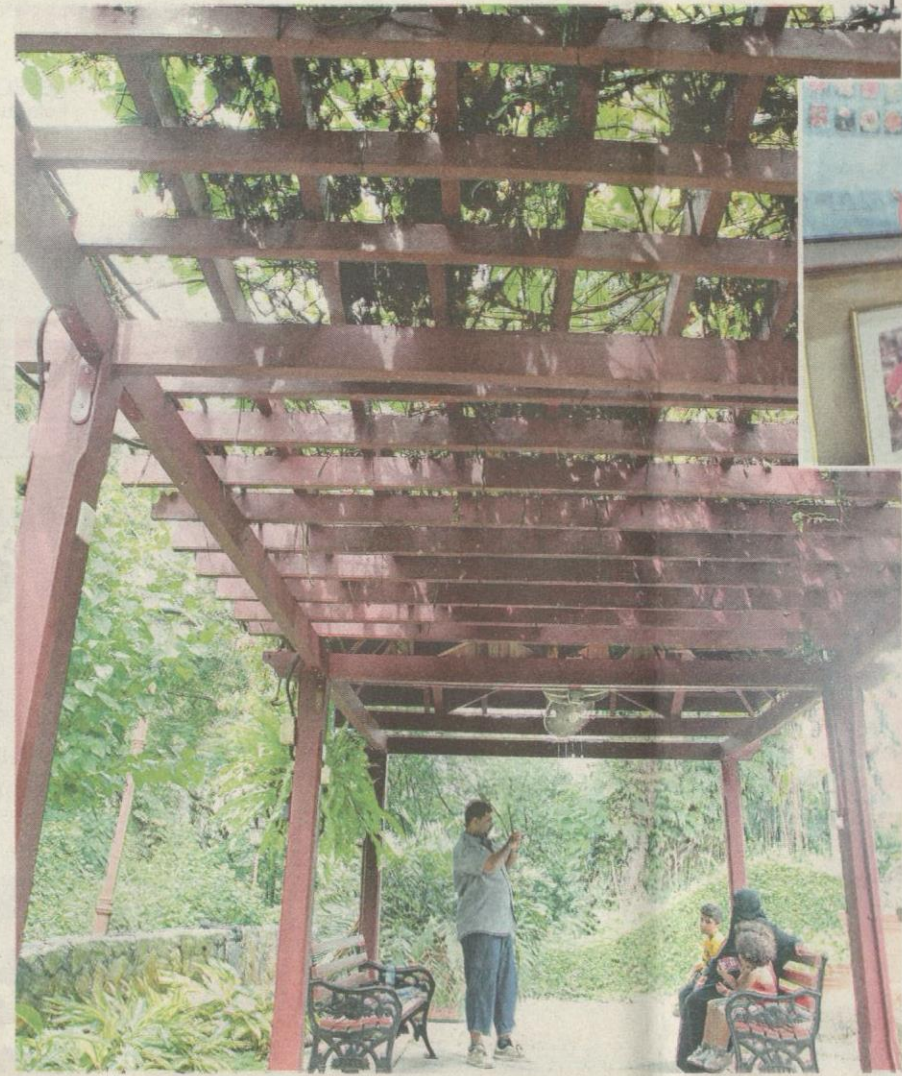
PENGUNJUNG tidak melepaskan peluang mengambil gambar di Taman Bunga Raya.

Bertemakan bunga raya, kawasan sekitarnya juga turut dilengkapi galeri khas untuk pameran di samping kemudahan-kemudahan awam seperti parkir, suar