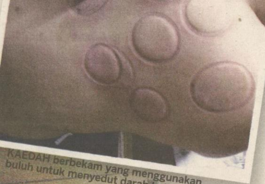
KAEDAH berbekam yang menggunakan buluh untuk menyedut darah kotor.