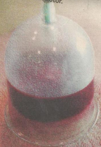
BEKAM chi gong tidak memerlukan sebarang torehan pada kulit.

Tanpa ditusuk dengan jarum atau ditoreh dengan pisau, darah kotor yang mengandungi toksin di seluruh bahagian badan pesakit dikeluarkan menggunakan tenaga dalaman yang dikenali sebagai chi .