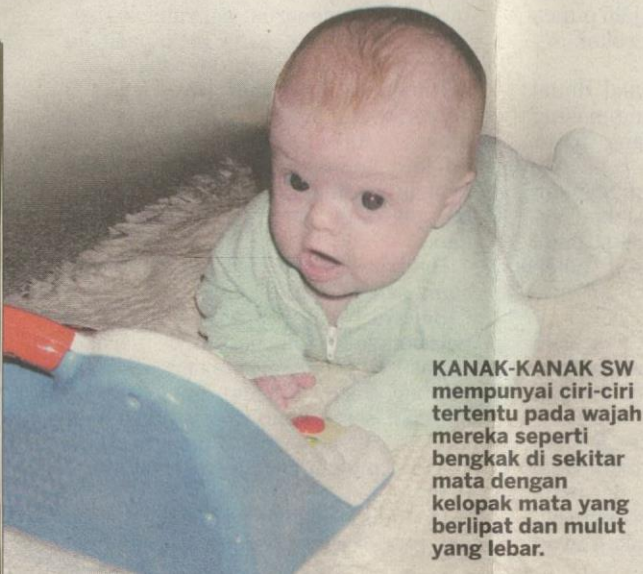
KANAK-KANAK SW mempunyai ciri-ciri tertentu pada wajah mereka seperti bengkak di sekitar mata dengan kelopak mata yang berlipat dan mulut yang lebar.

Kehilangan sebahagian cebisan ini menyebabkan 70 hingga 80 peratus penghidap SW berha-