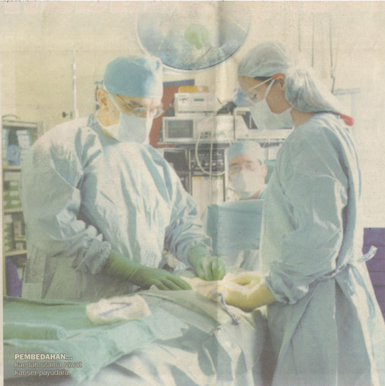
PEMBEDAHAN... kaedah utama rawat kanser payudara.

Pembedahan pemuangan payudara (mastektomi) dan membabitkan bahagian