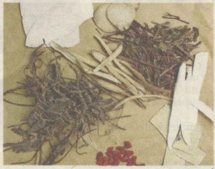
RAMUAN herba Cina ini dipercayai dapat membantu meredakan serangan gout.

Jelas Shahdan, gout berlaku disebabkan gangguan metabolisme asid urik yang tinggi dalam