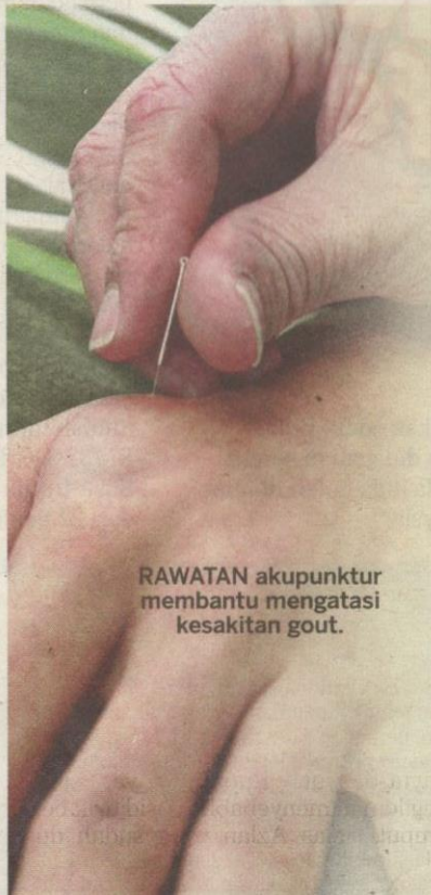
RAWATAN akupunktur membantu mengatasi kesakitan gout.

"Gout juga menyebabkan seseorang itu berisiko mengalami kerosakan buah pinggang pada kemudian hari," ujar Shahdan mengenai penyakit gout yang turut dialami 8.3 juta penduduk di Amerika Syarikat tiga tahun lalu.