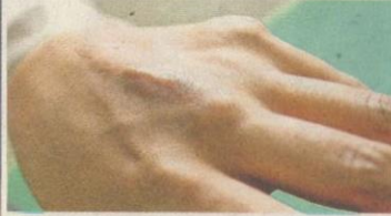
BAHAGIAN sendi yang diserang gout cukup sensitif dengan sentuhan walaupun kapas yang lembut.