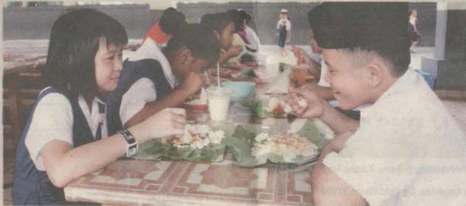
PENJUALAN nasi lemak di kantin sekolah pernah mencetuskan polemik kerana dianggap tidak seimbang. – Gambar hiasan

Dalam pada itu, penyediaan makanan di kantin sekolah dan pendidikan jas-