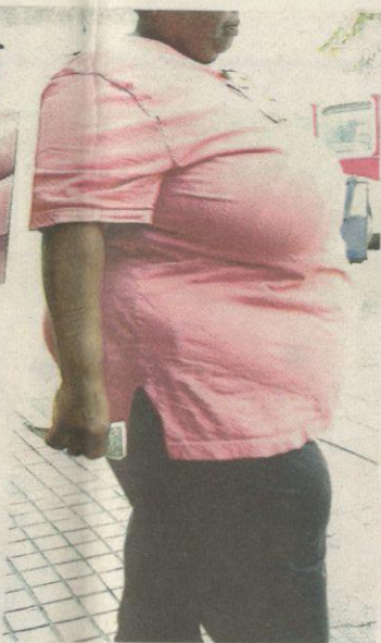
PENGAMBILAN makanan ringan menyumbang kepada masalah kegemukan atau obesiti.