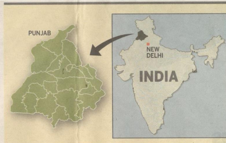
SEBANYAK 40 peratus wanita di Punjab, India mengalami obesiti.

ba masanya untuk dikuatkuasakan di negara ini.