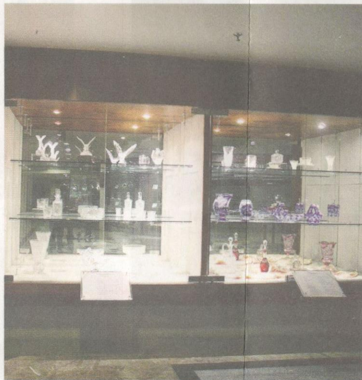
Koleksi hadiah kristal yang dipamerkan di Blok A Galeria Perdana.