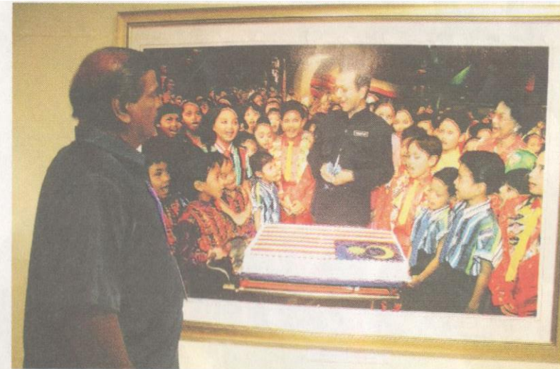
Seorang pengunjung sedang melihat gambar Tun Mahathir sedang meraikan kanak-kanak dalam satu majlis ketika beliau menjadi Perdana Menteri.