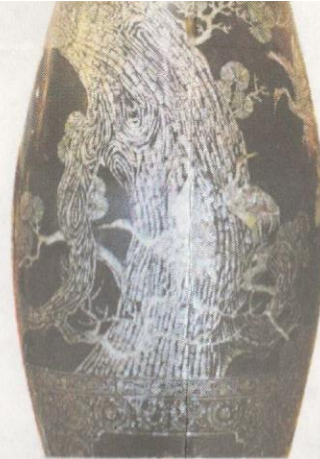
Pasu laker dengan ketinggian kira-kira 10 kaki, pemberian Thalexim, Republik Sosialis Vietnam menghiasi gerbang masuk Galeria Perdana.