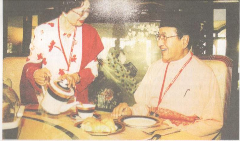
Gambar menunjukkan Tun Mahathir bersarapan dengan isterinya Tun Siti Hasmah di kediamannya di Seri Kembangan, Selangor sebelum bertolak ke Pusat Dagangan Dunia Putra (PWTC) bagi menghadiri Perhimpunan Agung Umno pada 21 Jun 2003.