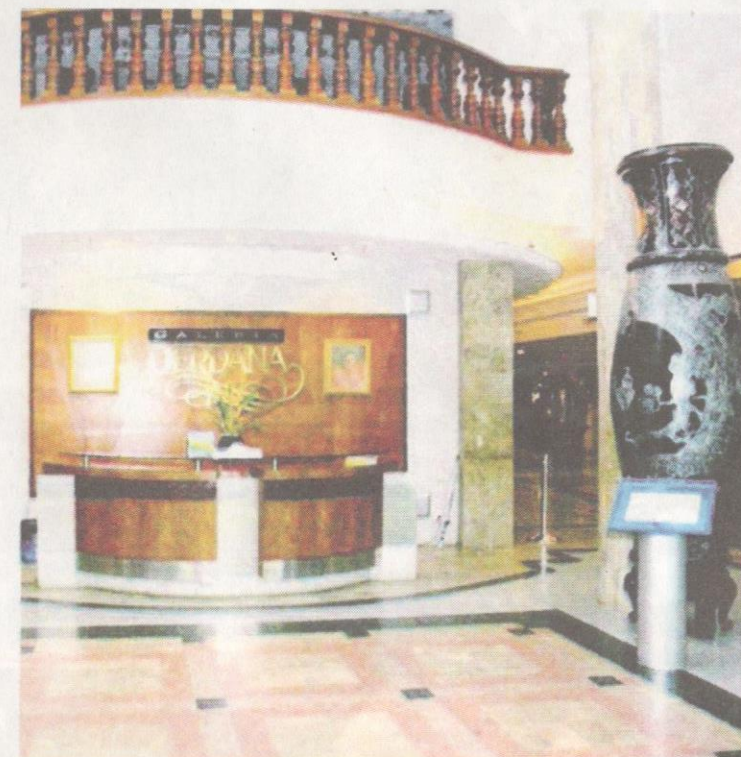
Gerbang masuk ke Galeria Perdana.