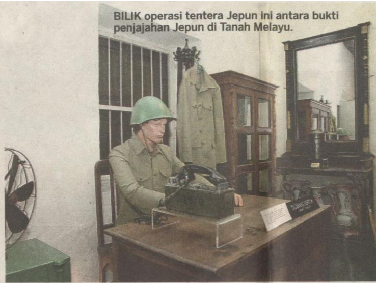
BILIK operasi tentera Jepun ini antara bukti penjajahan Jepun di Tanah Melayu.