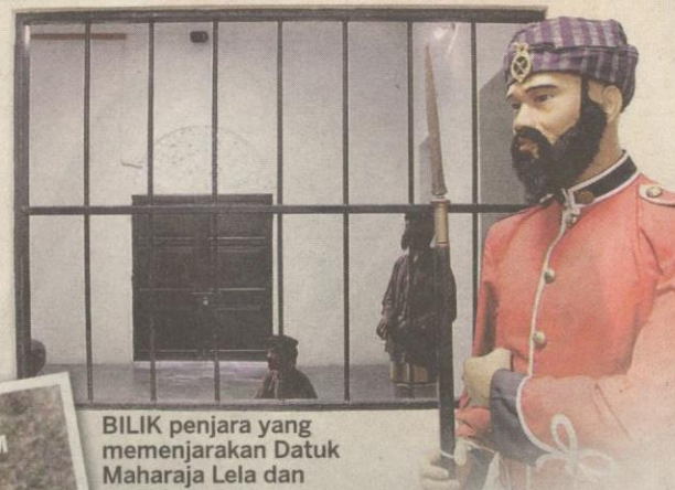
BILIK penjara yang memenjarakan Datuk Maharaja Lela dan pengikutnya.