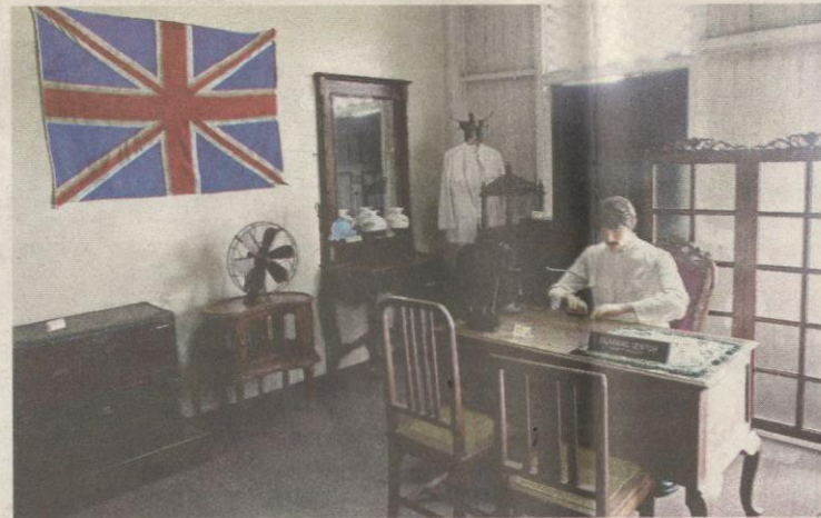
SALAH satu pejabat ruang pentadbiran British yang terdapat di kota Nгах Ibrahim.

“Nгах Ibrahim bersama 40 orang Melayu yang lain pula dibuang negeri ke Pulau Seychelles kerana dituduh bersubhat dalam pembunuhan Birch,” ujarnya. Kota Nгах Ibrahim yang diibaratkan khazanah utama Larut sekali lagi direntap penjajah apabila Jepun yang mahukan kota tersebut berfungsi sebagai markas pertahanan mereka selepas Perang Dunia Kedua.