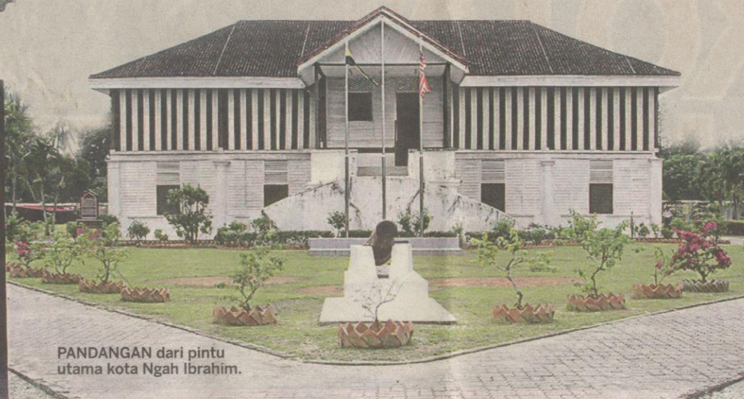
PANDANGAN dari pintu utama kota Ngah Ibrahim.

Kesumat Ngah Ibrahim dan pejuang Melayu Perak yang lain mengakibatkan terjadinya tragedi pembunuhan Residen Perak pertama, J.W.W Birch di Pasir Salak seterusnya membawa ke- pada kemurkaan British terhadap orang Melayu.