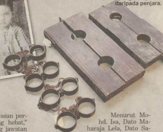
ALAT yang digunakan bagi menyeka Datuk Maharaja Lela dan pengikutnya lari daripada penjara.

menerajui Larut sebagai kawasan pertanian dan perusahaan yang hebat," katanya yang kini memegang jawatan sebagai Orang Kaya Menteri Paduka Tuan, Orang Besar Jajahan Larut, Matang dan Selama.