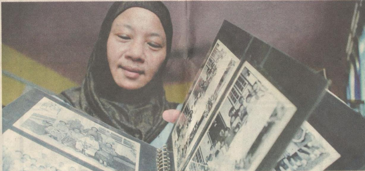
ROZLIN menunjukkan koleksi gambar Za'ba yang masih dalam simpanannya.