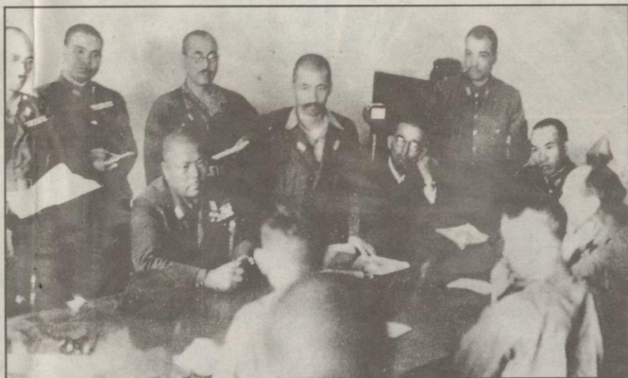
JENERAL Yamashita (duduk paling kiri) semasa menerima nota kekalahan pihak berikat di Singapura pada 15 Februari 1942.

kaian jalan raya yang baik antara bandar-bandar utama di Tanah Melayu selain banyak laluan pedalaman seperti jalan kampung dan jalan estet memberi kelebihan jika basikal digunakan.