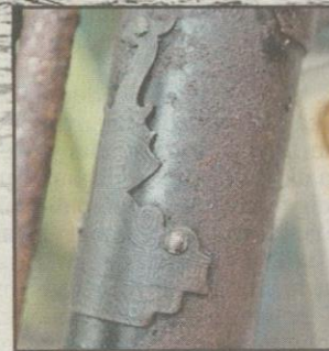
LOGO Raleigh buatan England. Basikal ini dipamerkan di Muzium Perang Batu Maung, Pulau Pinang.