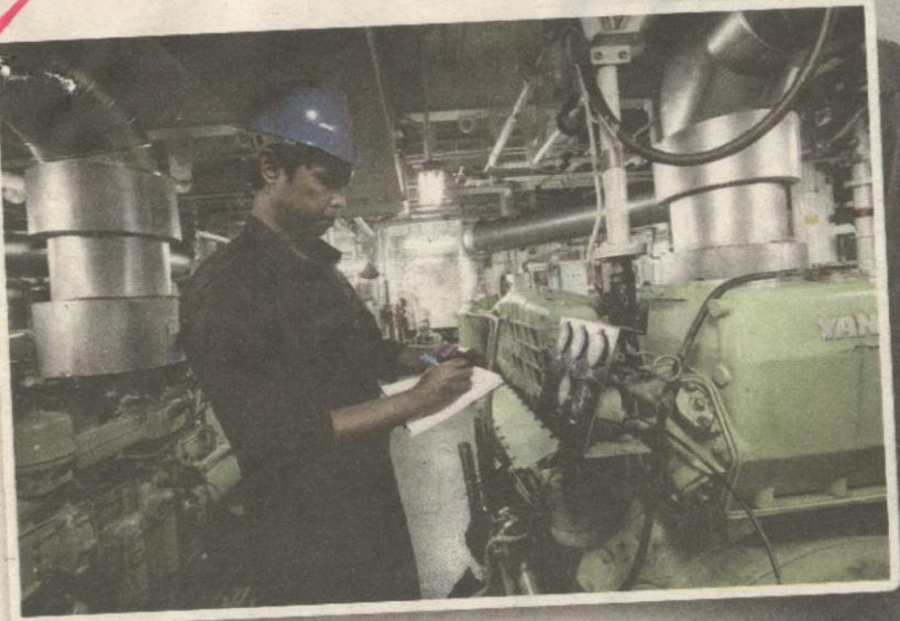
JURUTERA antara kerjaya yang ditawarkan dalam bidang perkapalan.

BERJAUHAN daripada keluarga tidak menjadi halangan kepada sesetengah individu yang mementingkan bidang perkapalan.