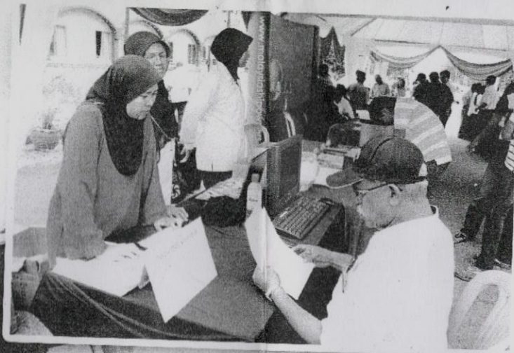
PELBAGAI pihak mengambil kesempatan membuka gerai masing-masing untuk memeriahkan sambutan Hari Pelaut.

“Bagi mereka yang baharu menyertai pasukan perkapalan misalnya sebagai seorang pegawai, mereka akan dibayar gaji tidak kurang daripada RM5,000”