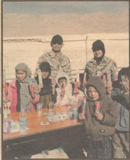
KANAK-KANAK menerima berus dan ubat gigi percuma.