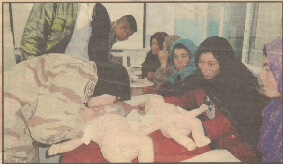
GOLONGAN wanita diajar kemahiran asas ketika kecemasan.