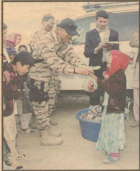
DAGING korban turut diserahkan kepada kanak-kanak Afghanistan.