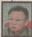
Kim Jong-Il Mewarisi daripada bapanya pada tahun 1994. Meninggal dunia pada 17 Disember 2011