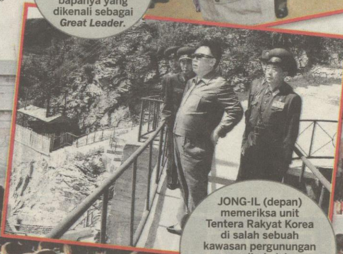
JONG-IL (depan) memeriksa unit Tentera Rakyat Korea di salah sebuah kawasan pergunungan yang dirahsiakan di Korea Utara. Gambar ini disiarkan di Tokyo pada bulan Ogos 1994.

JONG-IL memakai gelaran Dear Leader menggunakan acuan yang sama dengan bapanya yang dikenali sebagai Great Leader .