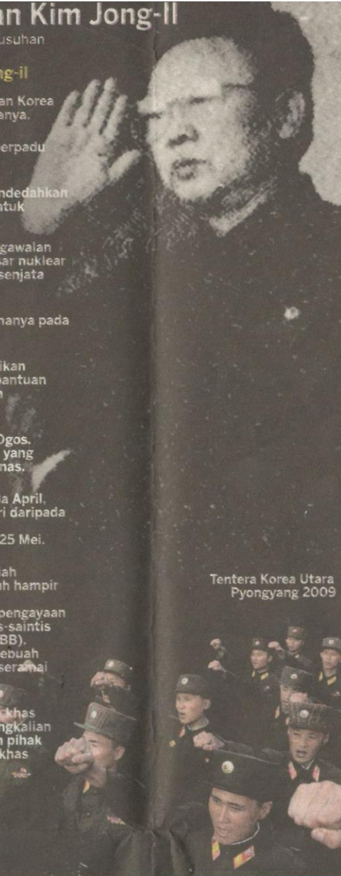
Tentera Korea Utara Pyongyang 2009