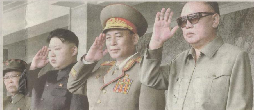
JONG-IL (kanan) dan anak lelakinya, Jong-un (dua dari kiri) memberi tabik hormat kepada perbarisan tentera di Dataran Kim Il Sung, Pyongyang, Korea Utara pada bulan September lalu.

menggelarnya sebagai Jeneral Bintang Pagi. Selepas dipilih selaku pewaris, Jong-un dipanggil Kapten Kim. Beliau pernah belajar di Sekolah Antarabangsa Berne di Berne, Switzerland sehingga tahun 1998. Namun, beliau tidak sempat menghabiskan pengajiannya di peringkat diploma.