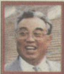
Kim Il-Sung Pengasas/Presiden Komunis Korea Utara

Kim Jong-un bersedia untuk mewarisi jawatan bapanya Kim Jong-il