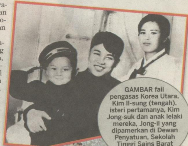
GAMBAR fail pengasas Korea Utara, Kim Il-sung (tengah), isteri pertamanya, Kim Jong-suk dan anak lelaki mereka, Jong-il yang dipamerkan di Dewan Penyatuan, Sekolah Tinggi Sains Barat Seoul, Seoul.

Jong-il masih seorang kanak-kanak apabila komunis Korea Utara menyerang Korea Selatan yang mendapat sokongan Amerika. Tindakan itu menentuskan Perang Korea pada tahun 1950. ▶▶