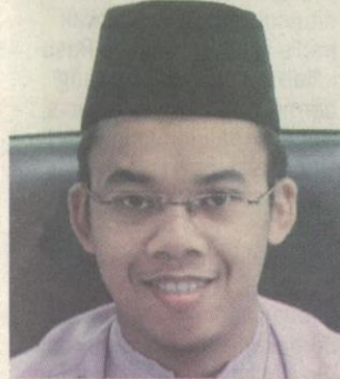
JASLAN... tiga kaedah menghadap kiblat.

belakangkan kiblat dalam sebarang perbuatan seperti membuang air besar atau kecil dalam keadaan tandas berdinging, tidur menelentang dan kaki selunjur ke arah kiblat.