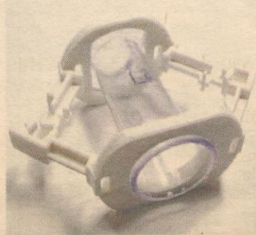
ALAT CLAMP... dimensi baru dalam proses berkhatan.