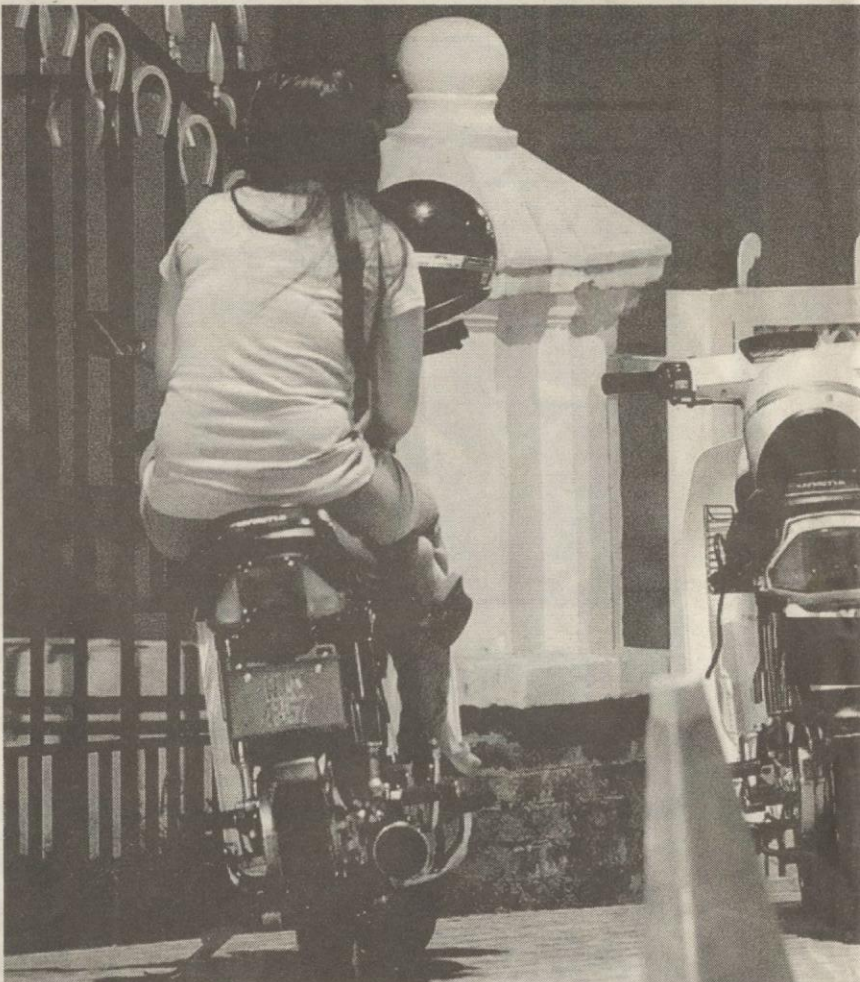
PERTAMBAHAN minah rempit dipercayai sub-budaya baru dalam komuniti masyarakat serta semakin menguasai dunia jalanan.