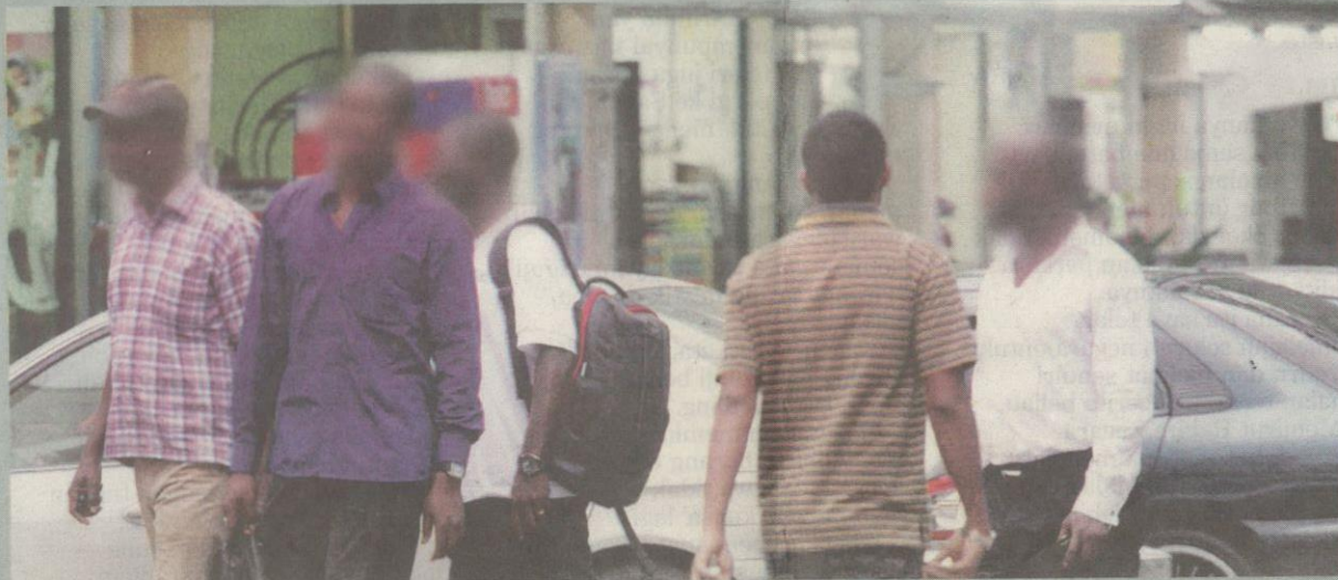
KEBANJIRAN warga Afrika di taman perumahan sering mengundang rasa tidak selesa penduduk tempatan gara-gara perlakuan tidak senonoh.

"Apa yang sering berlaku semasa pemeriksaan ialah mereka akan cuba menipu dengan mendakwa dirinya pelajar kolej, tetapi