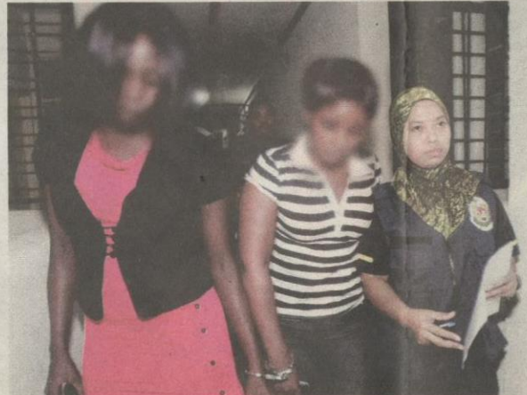
WANITA Afrika turut terlibat dalam kegiatan pelacuran terutamanya di sekitar Lembah Klang.

Akibatnya, lelaki bertubuh besar dan sasa itu mampu merentap gari di tangannya sehingga terputus lalu terpelanting dan ter-