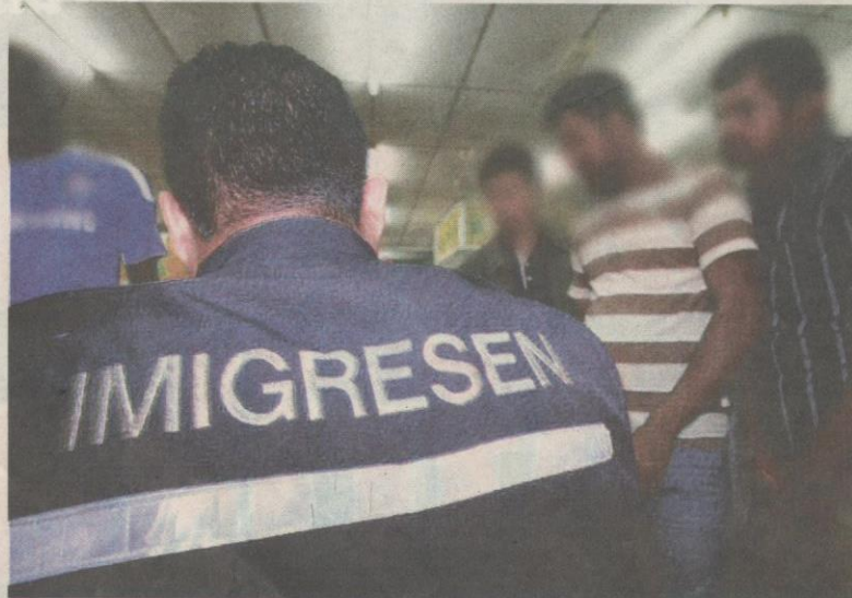
KEBANYAKAN kesalahan yang dilakukan oleh pendatang Afrika ialah memiliki dokumen perjalanan palsu dan tinggal melebihi tempoh di negara ini.

Bagaimanapun, suspek nekad untuk menyerang anggota polis terbabit dengan besi katil sehingga memaksa dua lagi das tembakan dilepaskan yang mengakibatkan kematiannya di lokasi kejadian.