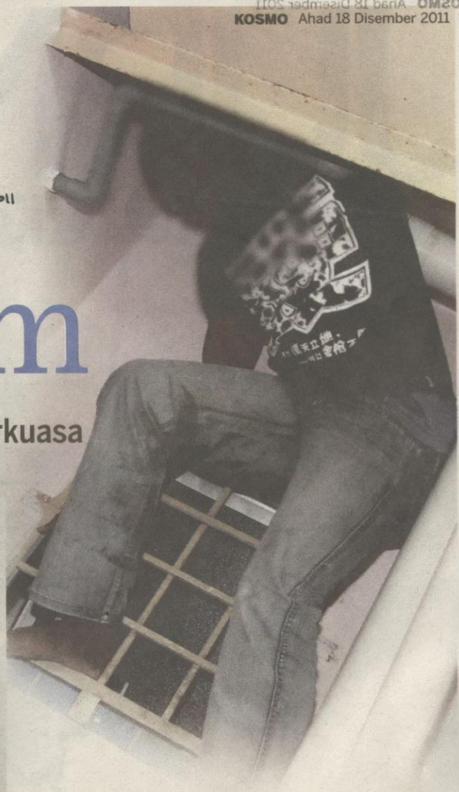
SEORANG warga Afrika menyorok di atas tangki tandas ketika serbuan Ops 6P di Nilai baru-baru ini.