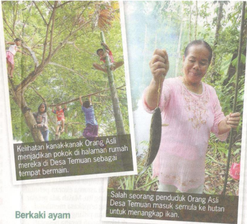
Kelihatan kanak-kanak Orang Asli menjadikan pokok di halaman rumah mereka di Desa Temuan sebagai tempat bermain.

Buktinya, kanak-kanak di kawasan perumahan itu begitu mahir memanjat pokok walaupun tidak lagi tinggal di dalam hutan sedangkan ibu bapa mereka tidak pernah mengajar selok-belok bergayut di dahan pokok.