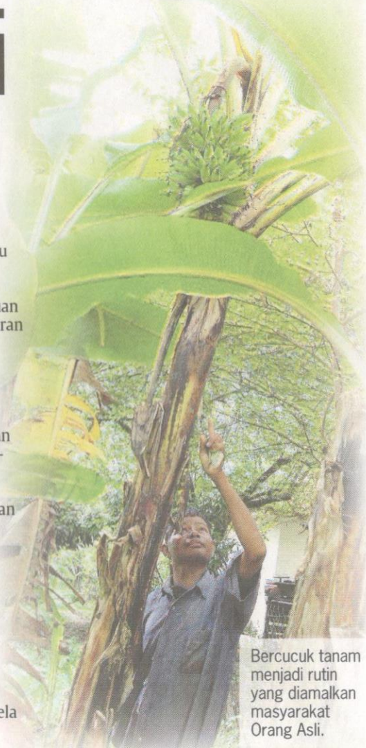
Bercucuk tanam menjadi rutin yang diamalkan masyarakat Orang Asli.

"Bantuan itu perlu digerakkan kepada mereka yang benar-benar telus dan menjalankannya agar usaha tidak separuh jalan," katanya yang mewakili NGO membela nasib Orang Asli di negara ini.