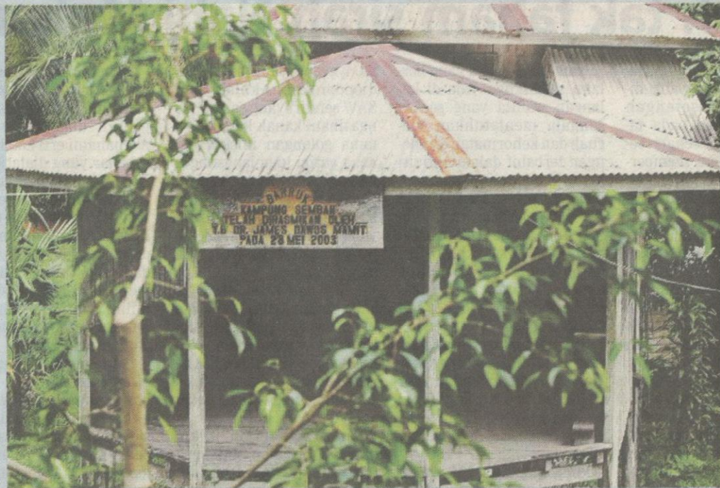
BALAI raya pertama Kampung Semban.

Perang potong kepala sejarah penting penduduk Bung Hlajang