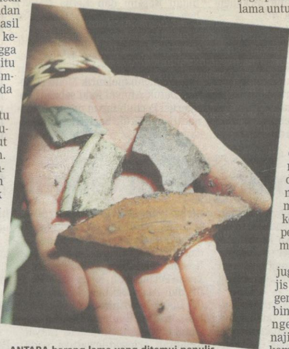
ANTARA barang lama yang ditemui penulis dalam perjalanan ke kebun kaum Embhan.

JANG TENGOI (tengah) ketua kaum yang paling disegani pada 1930-an bersama penduduk Embhan.