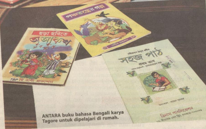
ANTARA buku bahasa Bengali karya Tagore untuk dipelajari di rumah.

“Bengal melahirkan ramai tenaga profesional dalam pelbagai bidang, ramai saintis dan tidak boleh dilupakan ia juga lokasi kemunculan tokoh masyarakat dalam bidang politik dan ketua perjuangan seperti Swami Vivekananda. Mereka ini sudah terkenal di seluruh dunia. Malah, selepas 150 tahun kematian Tagore, seluruh dunia masih mengingatinya.