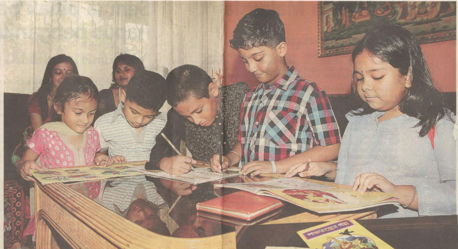
KANAK-KANAK Bengalee menerima pendidikan bahasa Bengali secara tidak formal di rumah.

lee dalam dua dunia berbeza iaitu kampung dan bandar, sekali gus menyebabkan mereka mudah berada di mana saja sehingga kini.