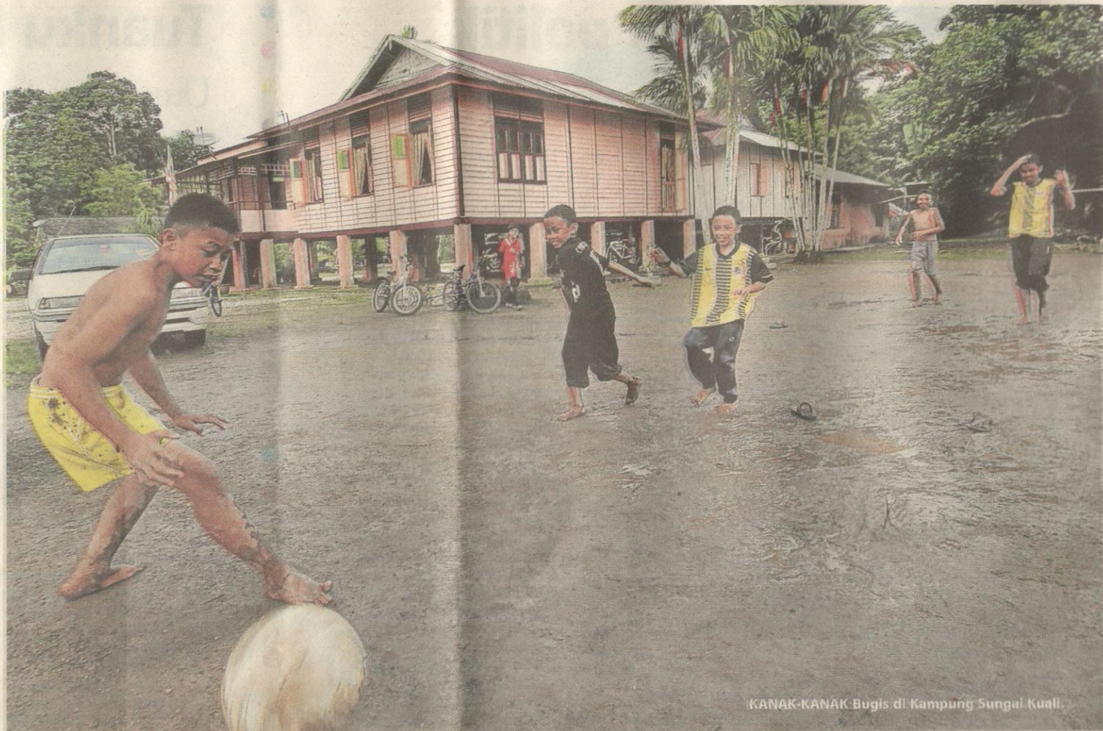
KANAK-KANAK Bugis di Kampung Sungai Kual.