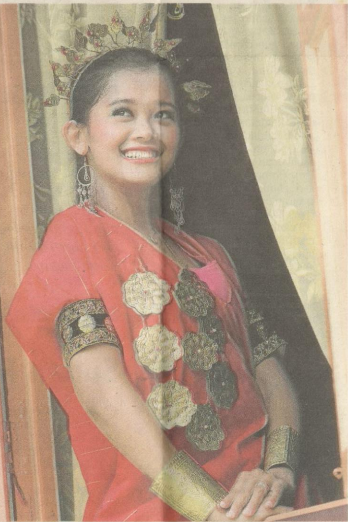
GADIS masyarakat Bugis.