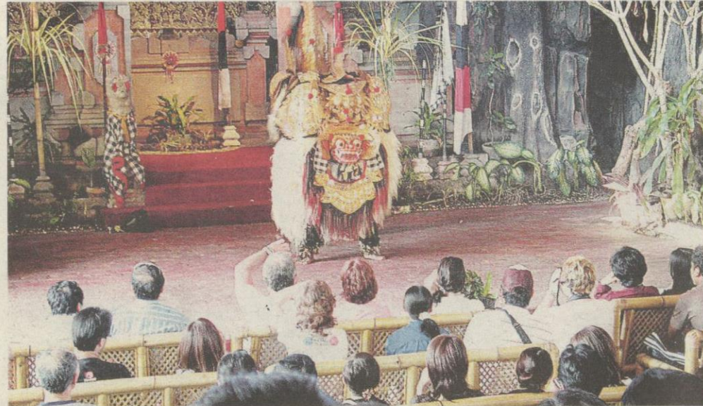
TARIAN Barong yang dipersembahkan di Kampung Batu Bulan menggamit ramai pelancong seawal pukul 10 pagi.