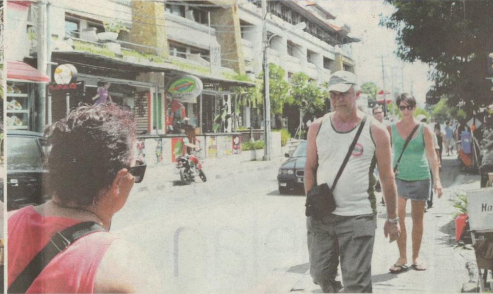
BERJALAN kaki lebih mudah jika anda bersiar-siar di sekitar Kuta.

◀ mengalu-alukan pelancong turut menyediakan kemudahan untuk pelancong beragama lain.