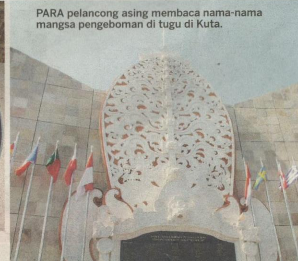
PARA pelancong asing membaca nama-nama mangsa pengeboman di tugu di Kuta.