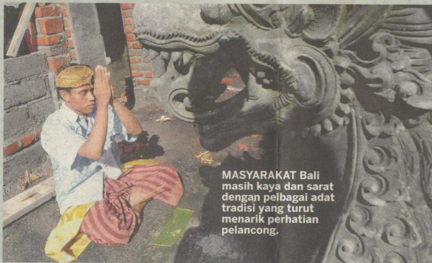
MASYARAKAT Bali masih kaya dan sarat dengan pelbagai adat tradisi yang turut menarik perhatian pelancong.

Kami yang menjejakkan kaki buat pertama kali di Pulau Bali, dalam kebingitan dan kerancakan suasana tidak jauh dari Ground Zero , terbayang tragedi pengeboman yang mengorbankan 202 orang. Pada masa yang sama, lebih 100 cedera di Sari Club dan Paddy's Cafe serta kawasan sekitarnya pada 12