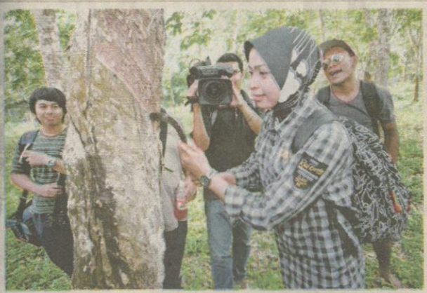
PENGUNJUNG tidak boleh melepaskan peluang mencuba aktiviti menoreh getah.

Dengan keadaan sekeliling tasik yang dipenuhi rimbunan pokok buah-buahan, sesiapa sahaja akan