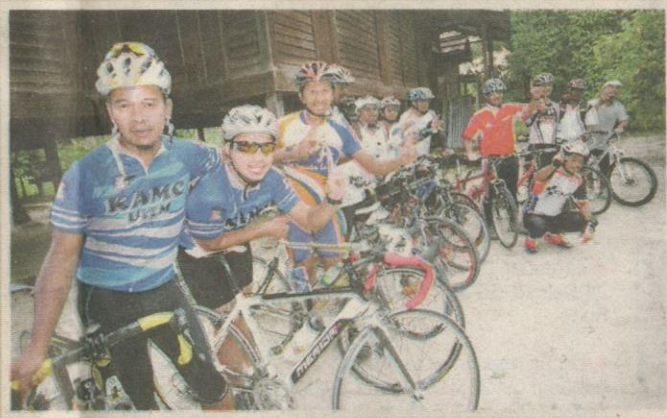
AKTIVITI berbasikal menjadi pilihan popular mereka yang ingin meneroka suasana kampung.