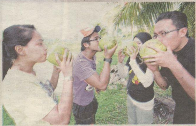
AIR kelapa muda begitu menyegarkan terutamanya selepas penat mengikuti aktiviti rekreasi.