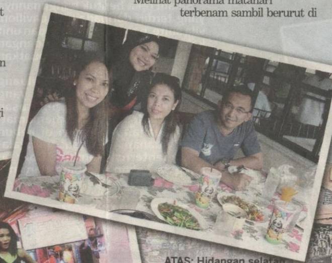
ATAS: Hidangan selatan Thailand yang lazim ditemui di Malaysia masih menjadi menu wajib pilihan penulis dan rakan-rakan di Patong.

Melihat panorama matahari terbenam sambil berurut di