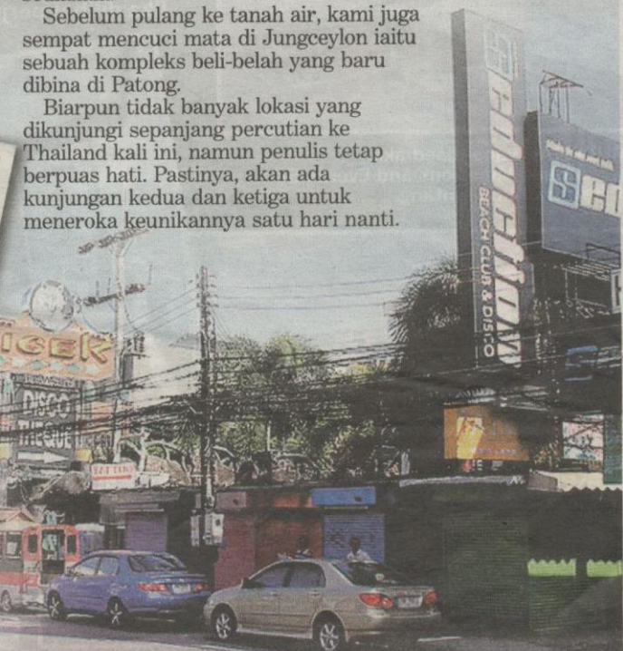
KEADAAN deretan kedai yang terdapat di Patong.

Biarpun tidak banyak lokasi yang dikunjungi sepanjang percutian ke Thailand kali ini, namun penulis tetap berpuas hati. Pastinya, akan ada kunjungan kedua dan ketiga untuk meneroka keunikannya satu hari nanti.