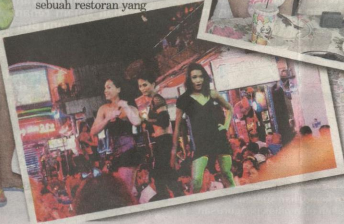
AKSI mengiurkan penari-penari Ladyboy menghangatkan suasana malam di sekitar Bangla Road.