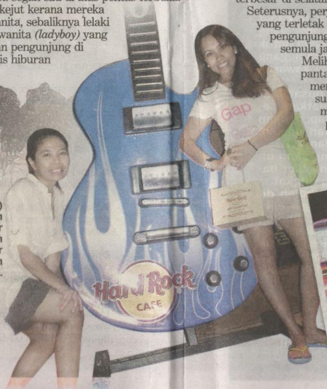
ni bina Thailand menghiasi Phuket a memukau