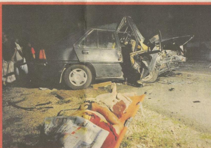
NGERI...mayat Wee ditutup dengan surat khabar selepas dibawa keluar dari kenderaan yang remuk.