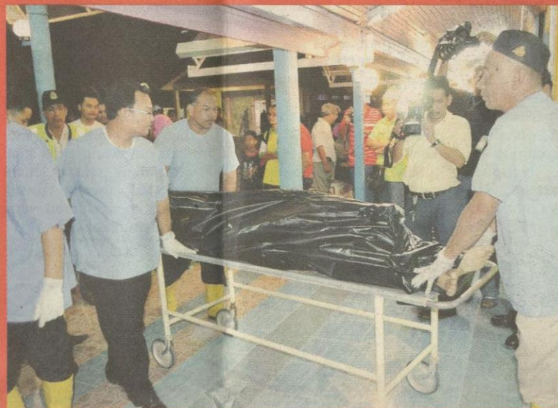
MAYAT...seorang daripada tiga mangsa dihantar ke Unit Forensik HPM untuk urusan pengebumian, malam kelmarin.