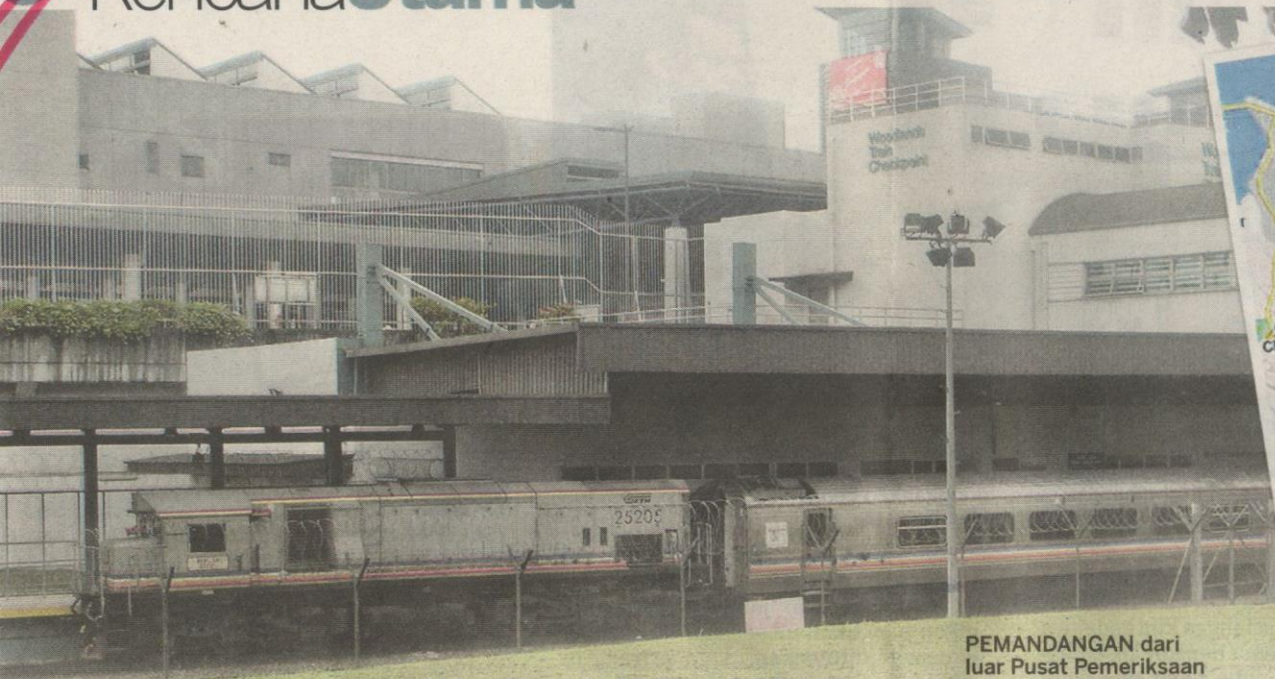
PEMANDANGAN dari luar Pusat Pemeriksaan Kereta Api Woodlands.