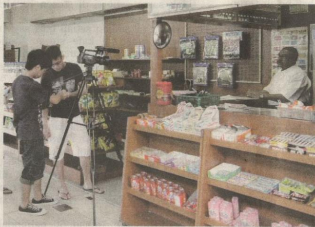
STESEN ini mendapat liputan luar biasa bukan sahaja daripada media tempatan malah pengamal media antarabangsa.

Penulis masih berdiri di tangga kereta api sehingga wajah stesen lenyap daripada pandangan. Selepas Pulau Batu Putih, pelabuhan Tentera Laut Diraja Malaysia (TLDM) di Woodlands dan Istana Kampung Gelam di tengah bandar Singapura yang pesat, kita kehilangan Tanjong Pagar. Seperti harapan rakyat negara ini semoga Singapura tidak memadamkan sejarah stesen Tanjong Pagar seperti terpadamnya sejarah Temasik.