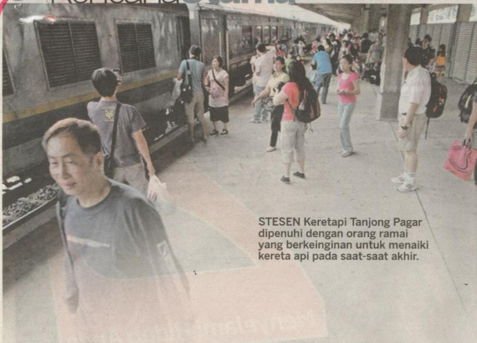
STESEN Keretapi Tanjong Pagar dipenuhi dengan orang ramai yang berkeinginan untuk menaiki kereta api pada saat-saat akhir.