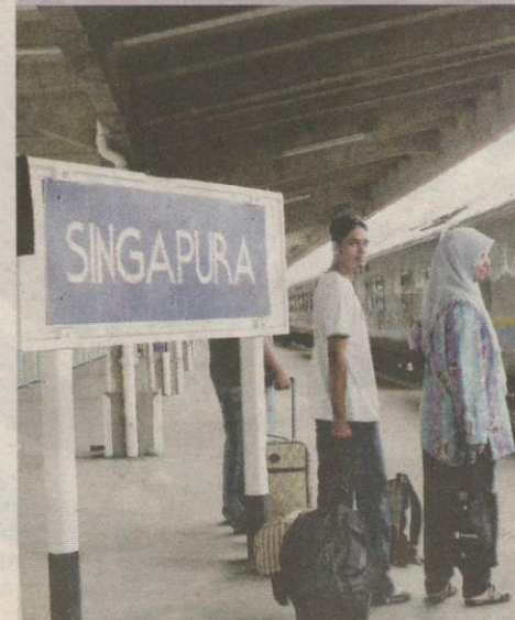
PAPAN tanda Singapura ini menjadi lokasi kegemaran pelancong untuk merakam foto.