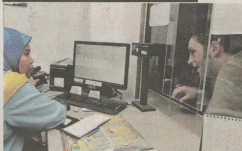
SELEPAS diumumkan untuk ditutup, jualan tiket di stesen ini pernah mencecah 20,000 tiket sehari.