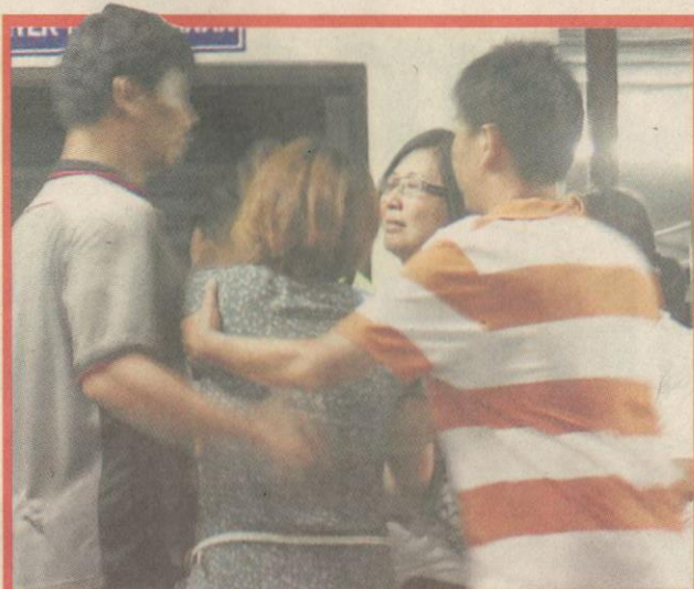
PILU...anggota keluarga mangsa sebak ketika ditemui di Unit Forensik HKT.

Kes disiasat mengikut Seksyen 41(1) Akta Pengangkutan Jalan (APJ) 1987 dan saksi kejadian diminta tampil membantu siasatan.