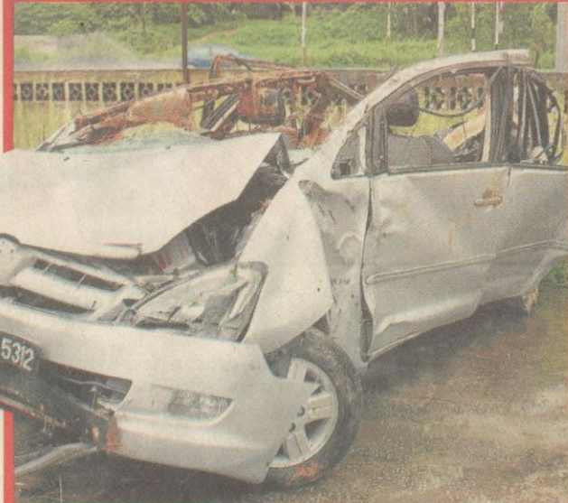
KOPAK...bumbung Innova tercabut selepas terjunam ke dalam gaung.