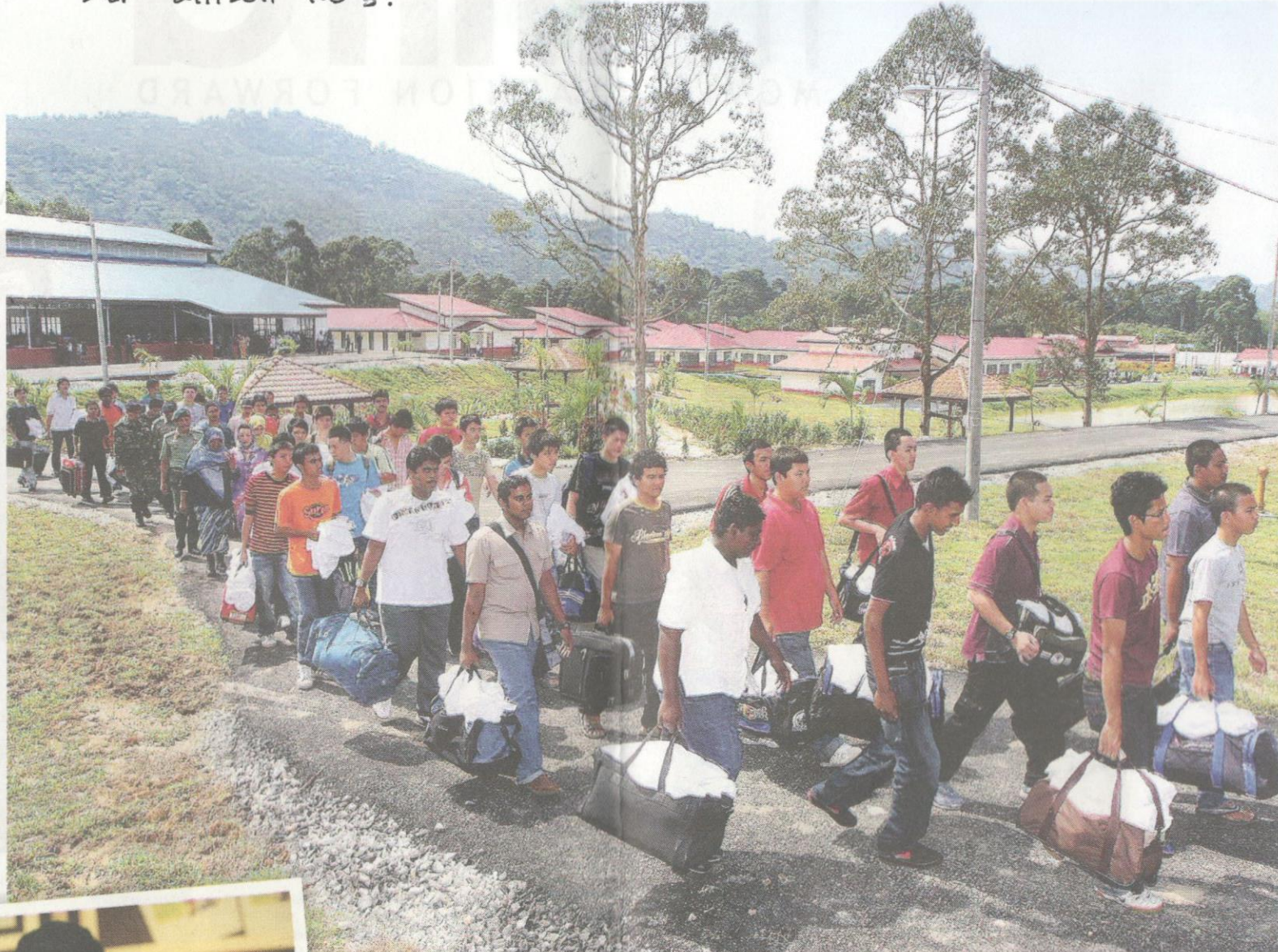
Pelatih yang baru tiba ke kem latihan bakal ditempatkan di asrama yang disediakan.

"Yang mengumpul dan menggerakkan aktiviti untuk bekas pelatih adalah ahli jawatankuasa yang ditempatkan di kem-kem latihan," katanya.