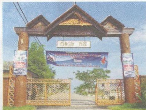
Kem PLKN Cancun Park di Mukim Bukit Tuku, Daerah Cancun, Lubok Jong, Pasir Mas, Kelantan.

Di atas kertas, sebanyak 451 pelatih yang majoritinya baru selesai menduduki peperiksaan Sijil Pelajaran Malaysia (SPM) dijadualkan mendaftarkan diri pada sesi