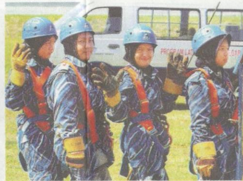
Antara pelatih yang menjalani latihan di Kem Cancun Park, Pasir Mas.

Ujarnya, para pekerja di dewan makan perlu menunjukkan sijil perakuan menunjukkan mereka telah menerima suntikan kesihatan dan menjalani kursus