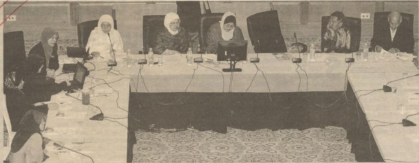
PESERTA Muzakarah Pakar, Menangani Zina serta Pembuangan Bayi di Kalangan Remaja dan Pelajar Sekolah anjuran IKIM.