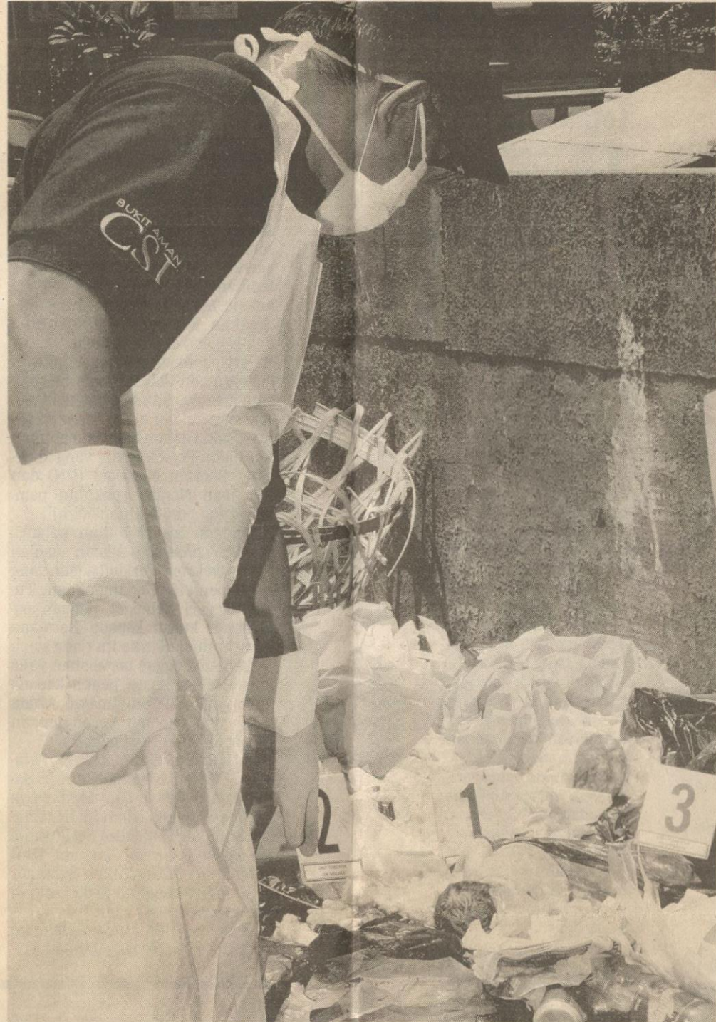
GEJALA pembuangan bayi makin berleluasa dalam masyarakat kini.