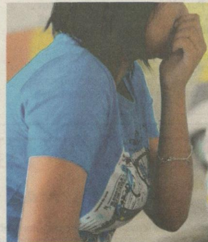
MIMI hampir putus asa dalam hidup.

“Seterusnya saya telah dimasukkan ke wad kerana sakit. Di hospital saya telah terjumpa dengan kak Norlela (Pengerusi Pewahim) dan dia memberikan saya motivasi dan mencadangkan agar saya menginap sementara di Rumah Wahidayah