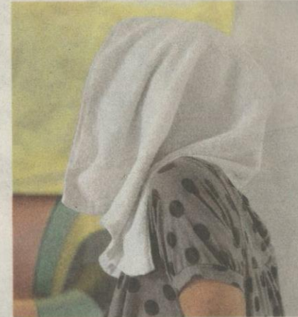
ALONG gembira berada di Rumah Wahidayah.

Dalam pada itu Along memberitahu sebaik kakinya melangkah keluar dari rumah mertuanya, dia tidak tahu hendak pergi ke mana. Kebetulan dia menyertai bengkel HIV/AIDS di Perak waktu itu dan mengetahui