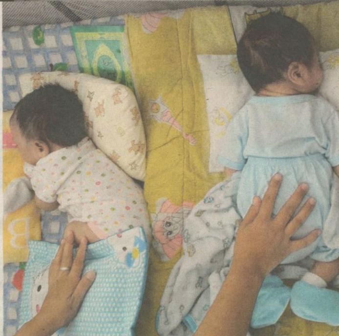
ANTARA bayi-bayi ibu tunggal yang menetap di Rumah Wahidayah.