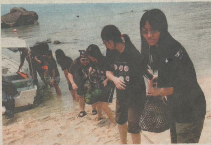
PROGRAM Sukarelawan Penyu mengajar setiap sukarelawan untuk sentiasa bekerjasama untuk melicinkan setiap aktiviti yang dijalankan.