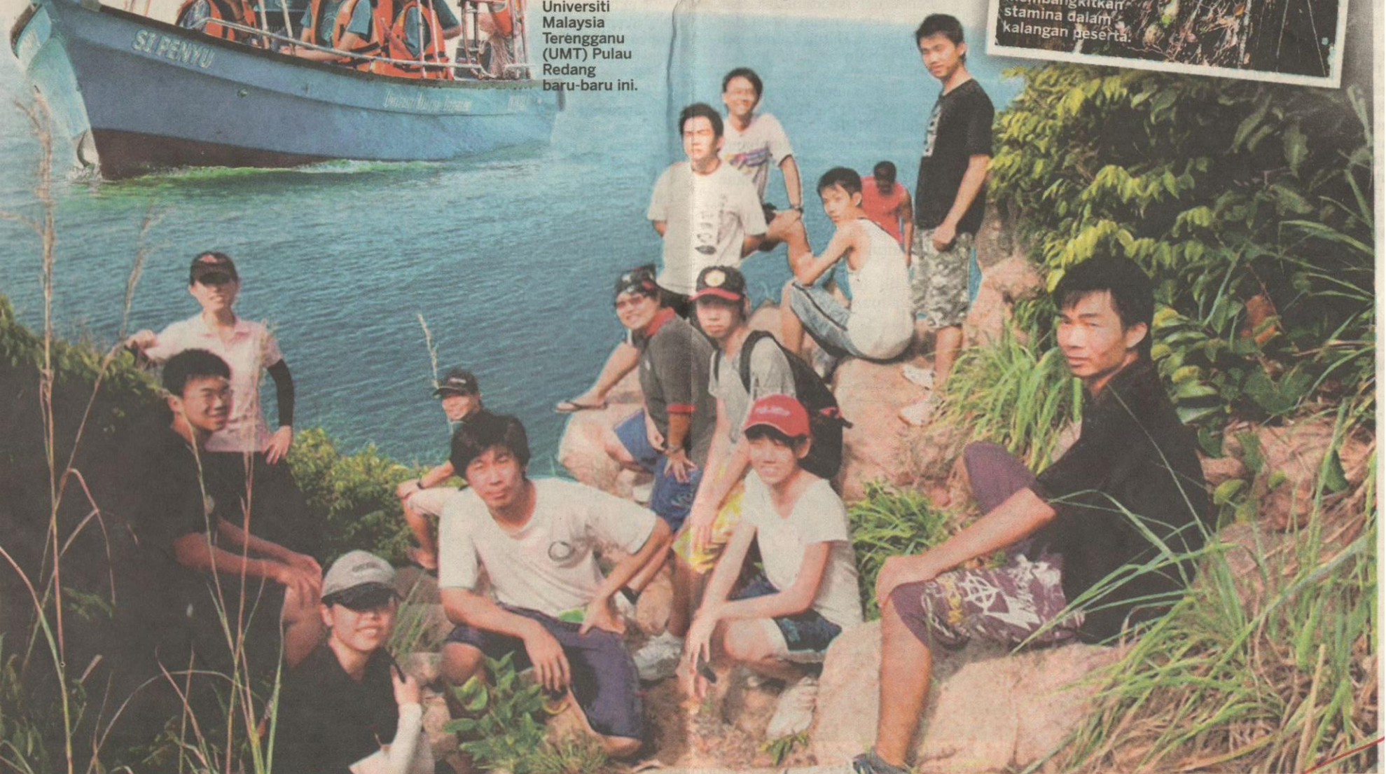
PESERTA berehat untuk melepaskan penat sambil menikmati keindahan alam sekitar selepas menjalani salah satu aktiviti pada Program Sukarelawan Penyu.

AKTIVITI mendaki turut diadakan bagi membangkitkan stamina dalam kalangan peserta.