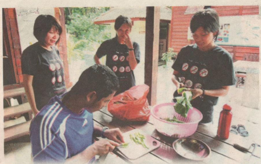
PESERTA bergotong-royong memasak makanan untuk hidangan makan tengah hari.