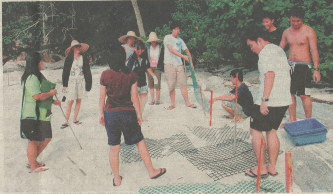
KANAN: Sarang penyu yang telah menetas dibuat analisis oleh para peserta bagi memastikan penyu dapat meneruskan kehidupan di laut lepas.