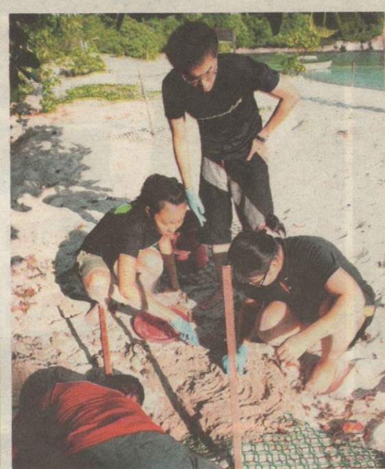
SUKARELAWAN membantu membuat analisis sarang penyu yang telah menetas.