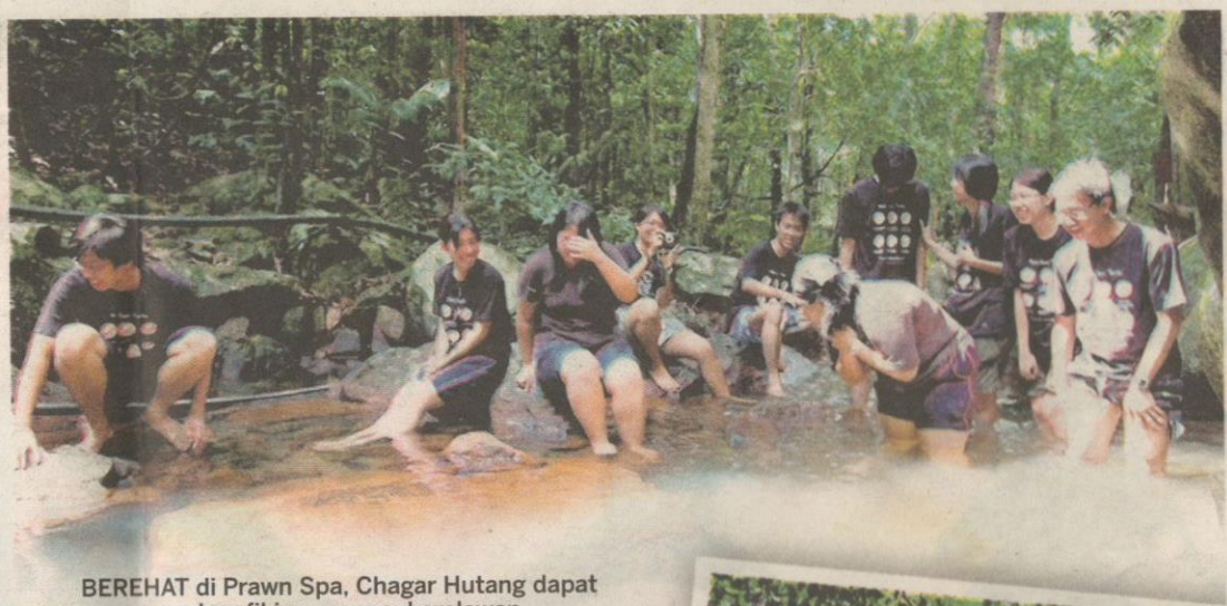
BEREHAT di Prawn Spa, Chagar Hutang dapat menenangkan fikiran para sukarelawan.

"Tinggal selama seminggu di Chagar Hutang merupakan satu pengalaman