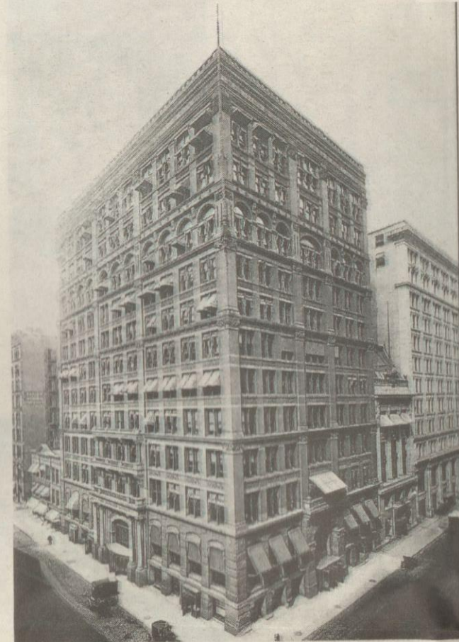
ANTARA TERAWAL...Home Insurance Building dibina pada 1885.

Contohnya, bangunan pencakar langit terawal di Amerika Syarikat, Home Insurance Building di Chi-