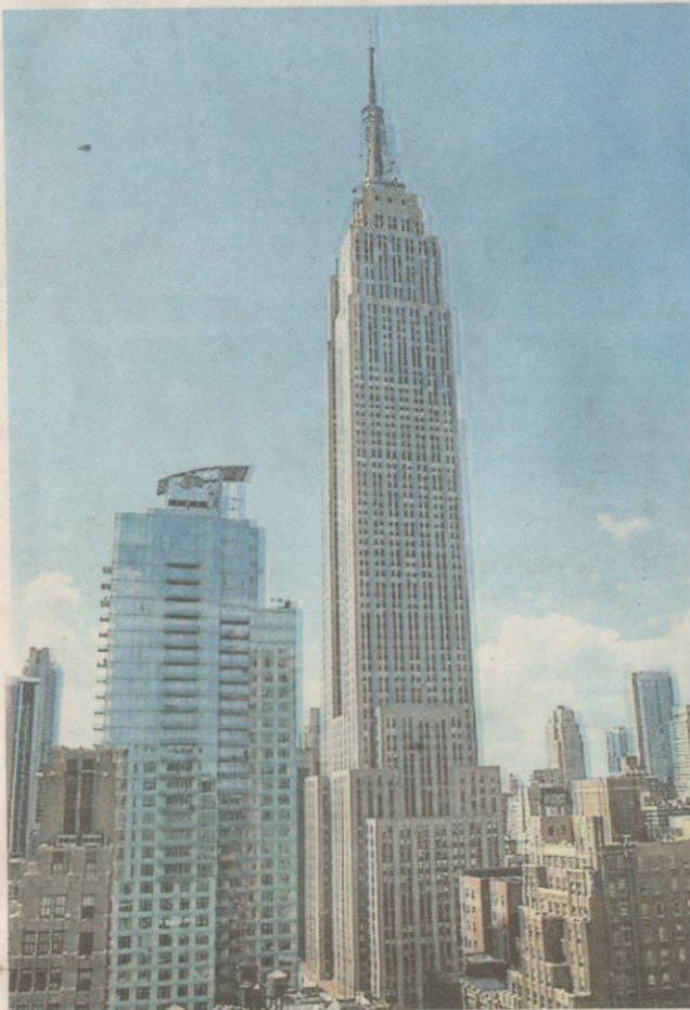
UNIK...binaan Empire State Building.