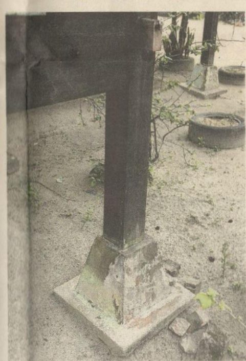
Tiang beralaskan batu jadi paksi rumah .

bagaimana langkah silat asal mereka, tetapi apa yang dipersembahkan kini ialah silat pulut.