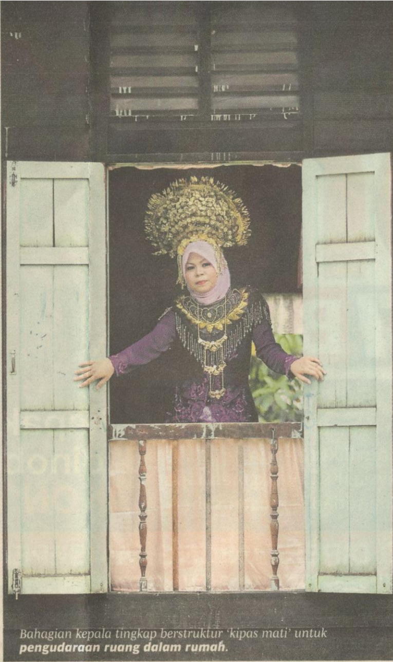
Bahagian kepala tingkap berstruktur 'kipas mati' untuk pengudaraan ruang dalam rumah.

ak dijadikan tiang tanpa menggunakan paku.