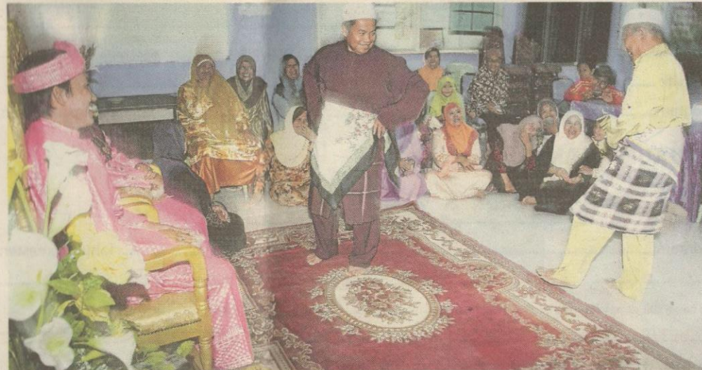
Gerak tari silat dipersembah di hadapan pengantin.

Palembang, Jambi dan Riau terutama loghat dengan akhiran 'o'. Penuturan orang Bangkahulu hampir mirip bahasa Melayu dialek Negeri Sembilan"