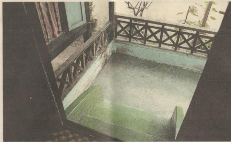
Ruang beranda rumah Bangkahulu.

Kami dipertontonkan dengan lagak dua warga emas melangkah lemah lembut dalam gerak tari silat di depan pengantin. Bagi mereka yang biasa menonton silat pulut di tempat lain, ia nyata tidak jauh beza. Begitu juga tari piring yang menonjolkan kemahiran penari mengawal piring di tangan, bezanya ia dipersembahkan oleh penari lelaki.