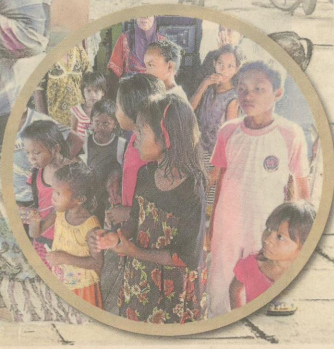
NEGATIF... ramai kanak-kanak sekitar Pasar Ikan Tawau terpaksa menjual rokok untuk menyara hidup.