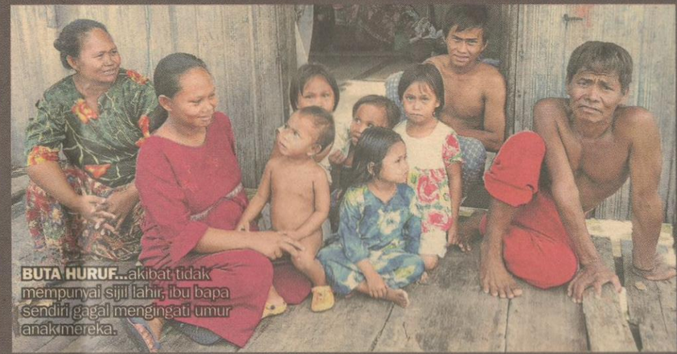
BUTA HURUF... akibat tidak mempunyai sijil lahir, ibu bapa sendiri gagal mengingati umur anak mereka.