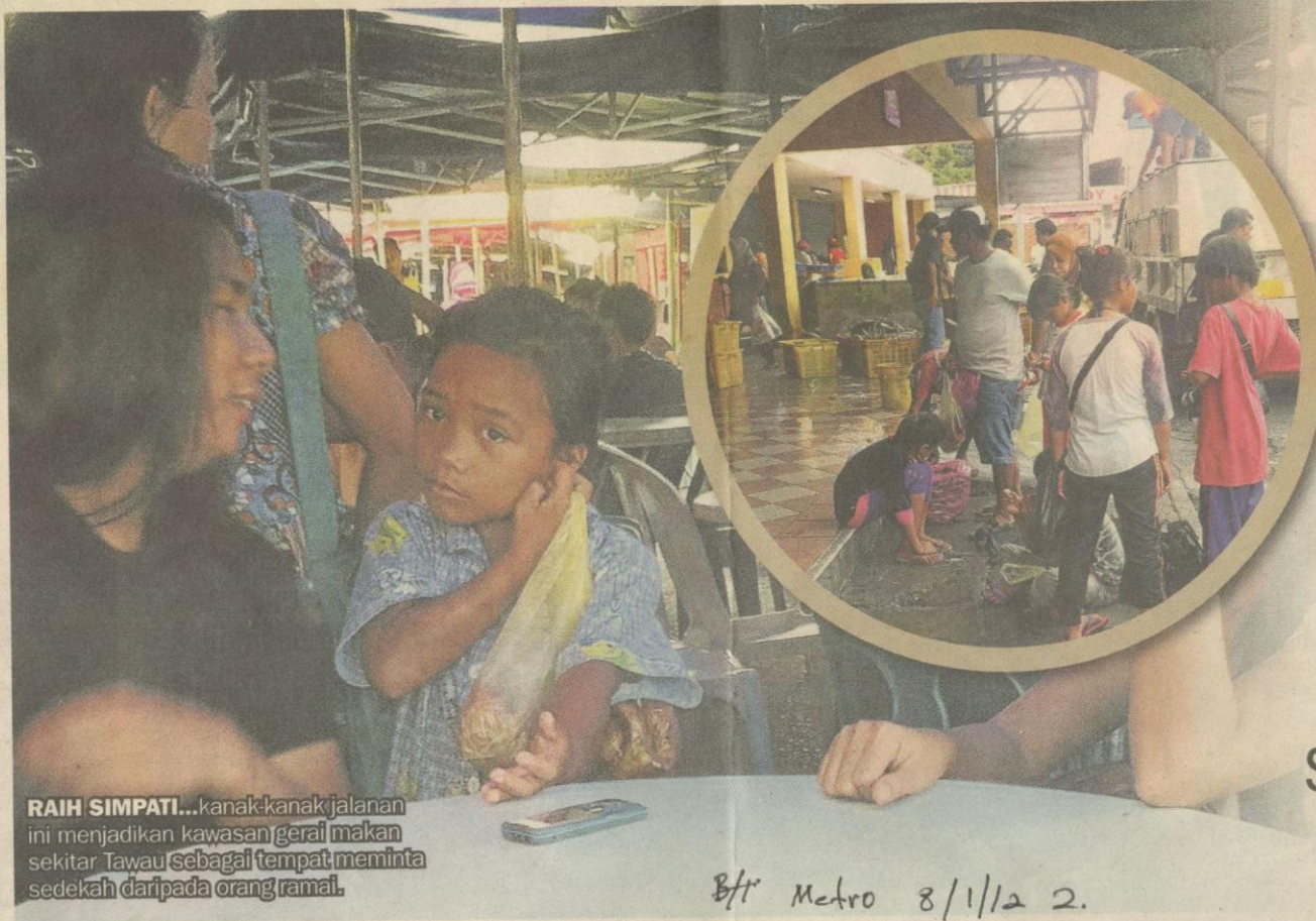
RAIH SIMPATI... kanak-kanak jalanan ini menjadikan kawasan gerai makan sekitar Tawau sebagai tempat meminta sedekah daripada orang ramai.

HIDUP ini penuh dengan cabaran, seperti langit ada cerah dan mendunginya. Ada masa kita bahagia, tetapi tidak kurang juga yang terpaksa mengharung derita. Mulai hari ini, Metro Ahad dan Harian Metro melalui ruangan Warna Kehidupan menelusuri secara bersiri pelbagai sisi kehidupan masyarakat, bahagia derita, suka dan lara bukan sekadar untuk berkongsi rasa, malah menjadikannya teladan atau sempadan dalam kita meneruskan kehidupan.