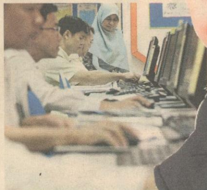
Individu bekerja layak buat potongan cukai ikut pendapatan.

» Masih ada wanita tak tahu buat tuntutan tepat