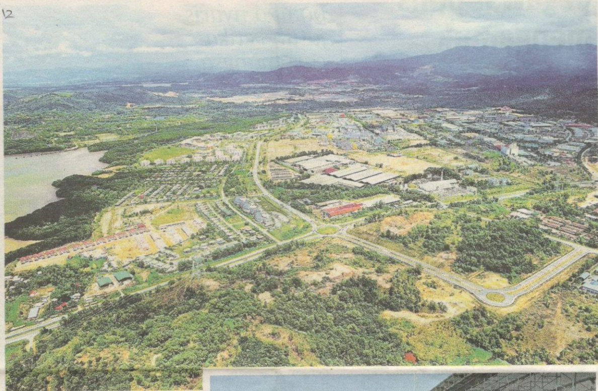
Taman Perindustrian Kota Kinabalu.

“Ini penting kerana kita mahu rakyat Sabah bekerja di tempat