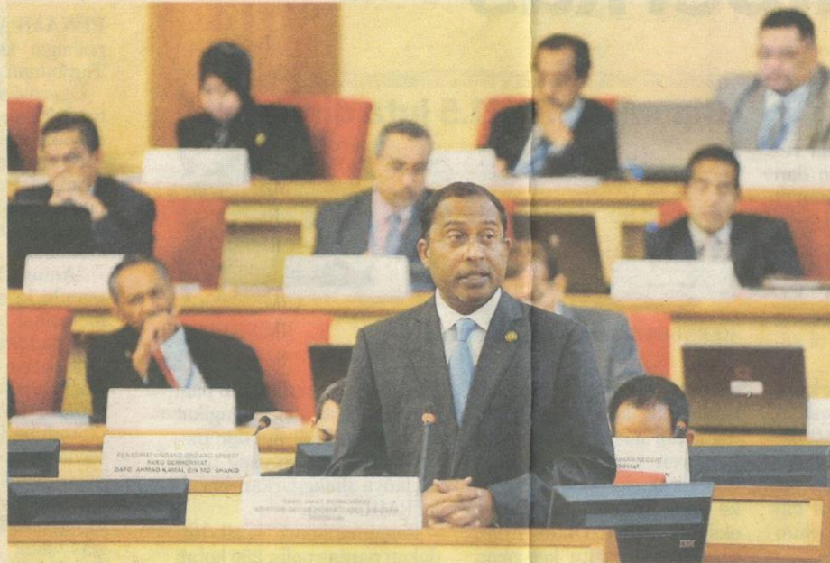
ZAMBRY (kanan) membentangkan Bajet Perak 2013 pada Persidangan Dewan Undangan Negeri di Ipoh semalam.

Selain itu, katanya, sebanyak RM79.1 juta (24.55 peratus) diperuntukkan untuk penerusan program sedia ada, RM51.5 juta (16 peratus) untuk modal insan dan perkhidmatan awam manakala RM24.5