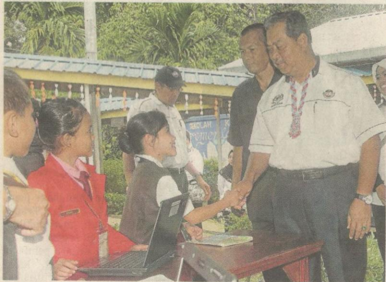
MUHYIDDIN berbual dengan murid selepas majlis pengiktirafan Sekolah Berprestasi Tinggi Kohort 2 di SK Ulu Lubai, Limbang, Sarawak.

Muhyiddin menambah: "Dalam melangkah ke hadapan, fokus Kementerian adalah untuk terus membangunkan rakyat Malaysia yang dapat bersaing pada peringkat global melalui peningkatan mutu pendidikan dan memperbaiki kaedah penyampaian guru. Objektif kementerian adalah menghasilkan komuniti yang berfikiran kreatif dan terbuka dan dapat menyumbang kepada tenaga kerja masa depan."