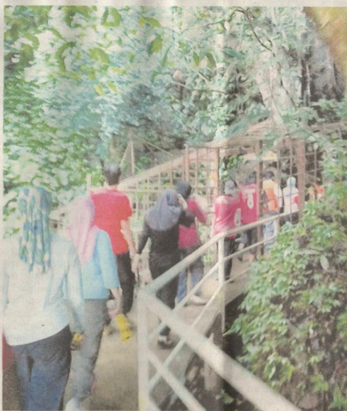
PERJALANAN masuk ke Gua Tempurung memberikan satu pengalaman baharu kepada pelajar yang terlibat.