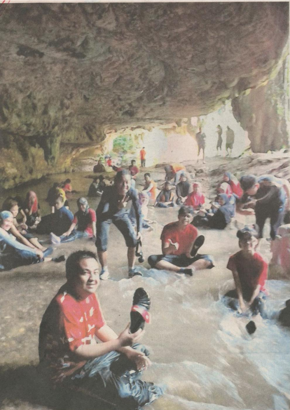
LAJAR mengambil peluang untuk berehat di sebatang sungai yang terdapat di dalam Gua Tempurung, Gopeng baru-baru ini.