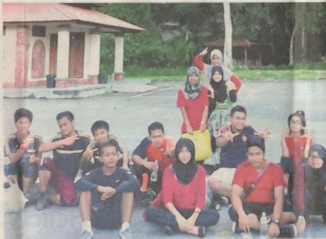
SEKUMPULAN pelajar yang menyertai eksplorasi ke Gua Tempurung bergambar kenangan sebelum meneruskan perjalanan ke Gua Tempurung.