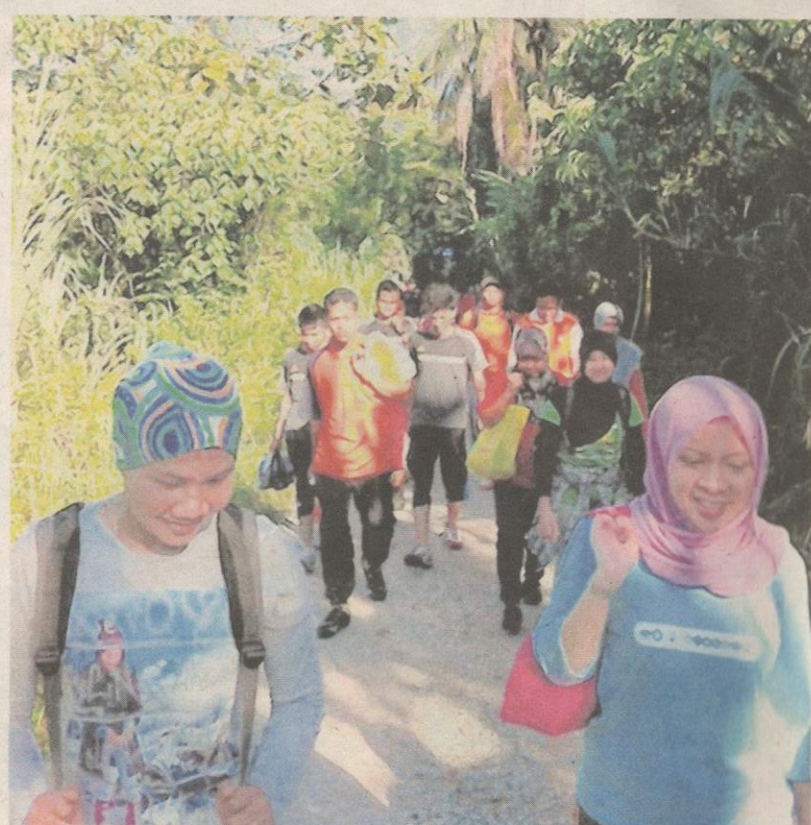
BERJALAN secara berkumpulan untuk menjelajah Gua Tempurung dapat menaikkan semangat setiap peserta terlibat untuk meneruskan perjalanan.