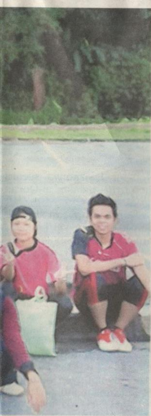
n perjalanan ke gua batu