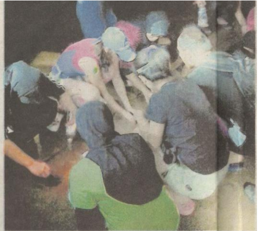
SISA bijih timah yang terdapat di dalam Gua Tempurung memberi peluang kepada pelajar mengutipnya untuk dibuat kenang-kenangan.

"Ini merupakan salah satu proses untuk mengenali pasti bakat dan kemahiran yang ada dalam diri peserta, seterusnya membuka peluang kepada pihak kami untuk menggilapnya ke peringkat lebih tinggi," katanya.