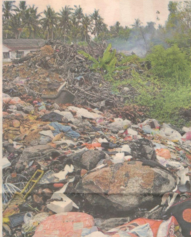
PEMBUANGAN sampah berterusan boleh menjejaskan ekosistem pesisir pantai di Kampung Parit Tujuh, Sungai Besar:

Difahamkan, pembakaran itu bertambah serius sebelum Tahun Baru