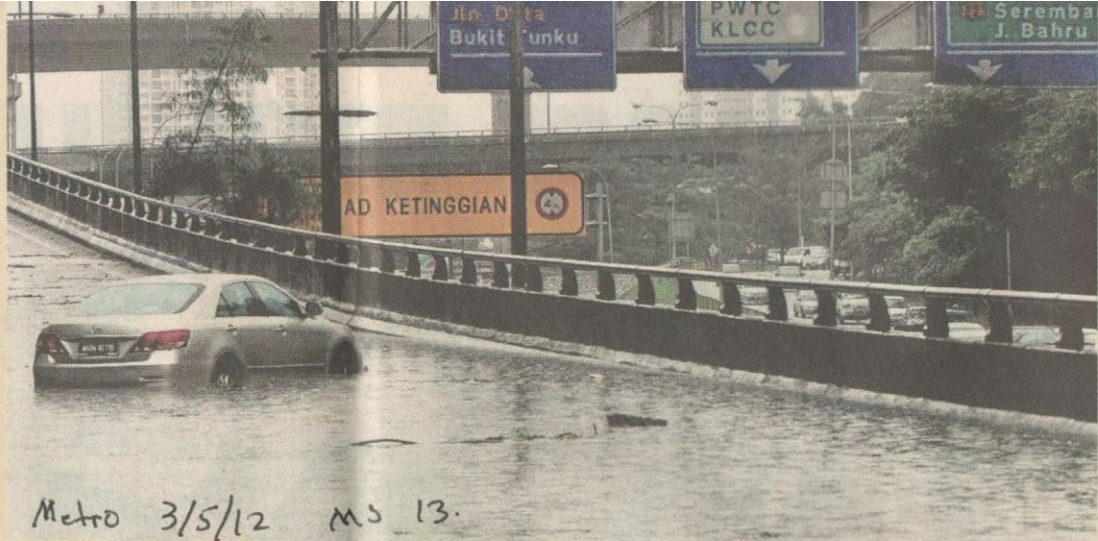
Metro 3/5/12 ms 13.