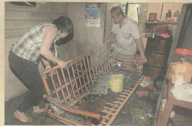
ROSAK... penduduk mengangkat perabot dilanda banjir kilat di pekan Salak Selatan.