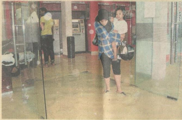
RIMAS... air memasuki ruangan depan sebuah bank di pekan Kajang.