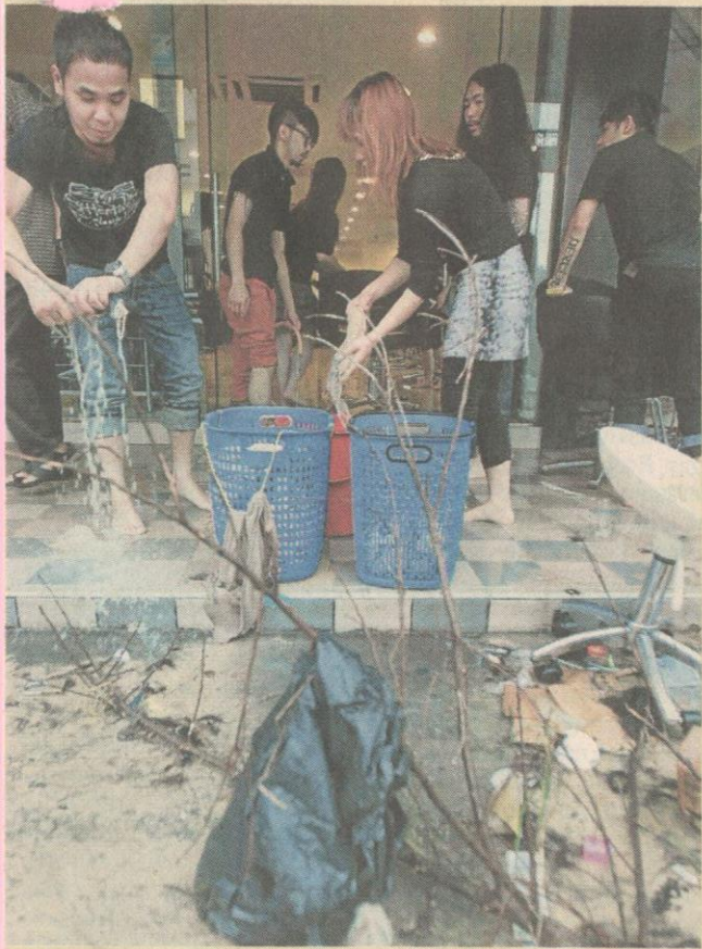
NASIB BADAN... pekerja bergotong-royong membersihkan salun kecantikan selepas banjir kilat melanda pekan Kajang.