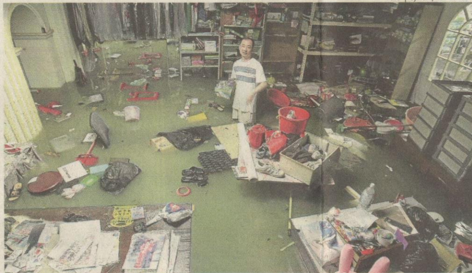
TENGCELAM...peniaga buntu kedainya di Pekan Salak Selatan dinaiki air paras lutut.

Kawasan lain yang turut terjejas termasuk pekan Salak Selatan, Bandar Sri Permai-