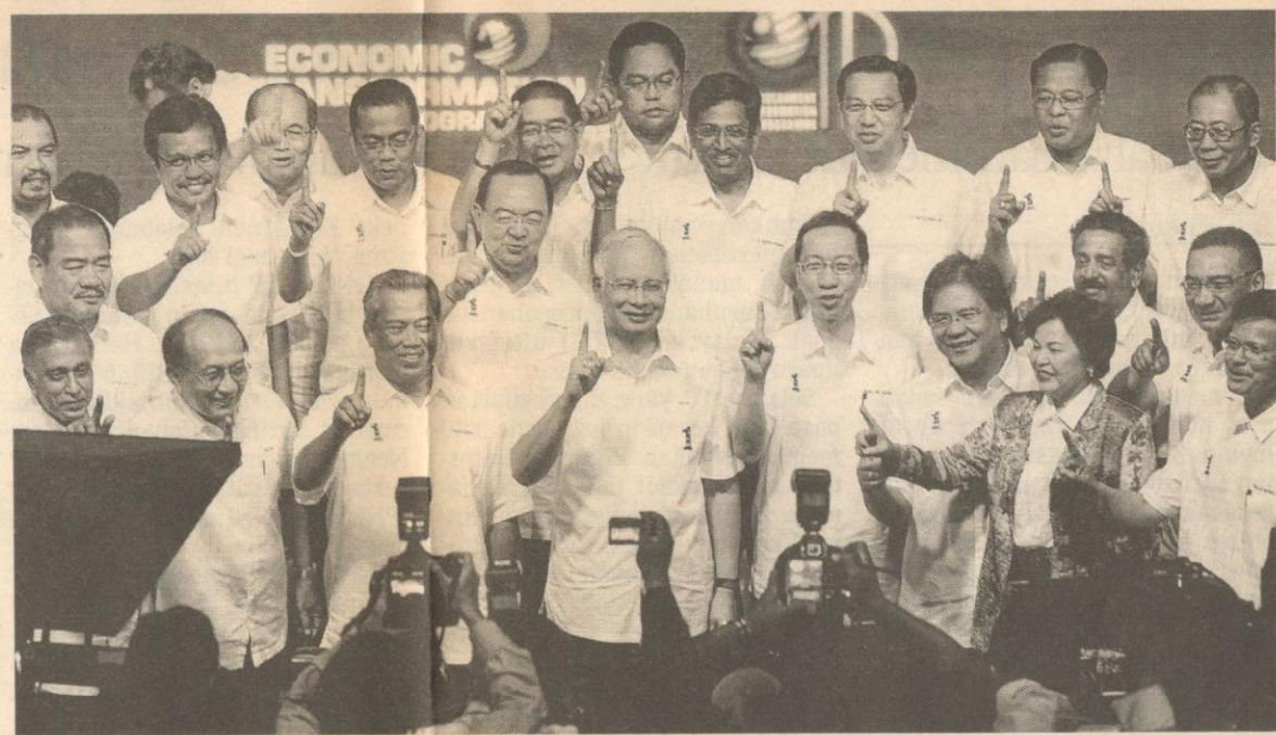
NAJIB bersama timbalannya, Tan Sri Muhyiddin Yassin dan anggota Kabinet yang lain menunjukkan jari simbol 1Malaysia pada Pelancaran Laporan GTP/ETP 2011 di Angkasapuri, Kuala Lumpur, malam tadi.

Kerajaan juga memberikan subsidi bil elektrik bagi satu juta isi rumah membabitkan bil bernilai RM20 ke bawah. Segala subsidi ini membabitkan peruntukan seba-