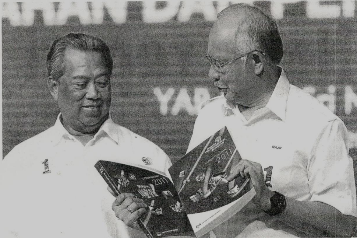
NAJIB dan Muhyiddin melihat laporan tahunan GTP dan ETP selepas membentangkan pencapaian GTP dan ETP, di Kuala Lumpur, malam tadi.

ETP pula membabitkan 12 Bidang Keberhasilan Utama Ekonomi (NKEA) berserta 131 Projek Permulaaan Ekonomi (EPP) yang dipacu Model Baru Ekonomi (NEM) dan Jajin Inisiatif Pembaharuan Stra-