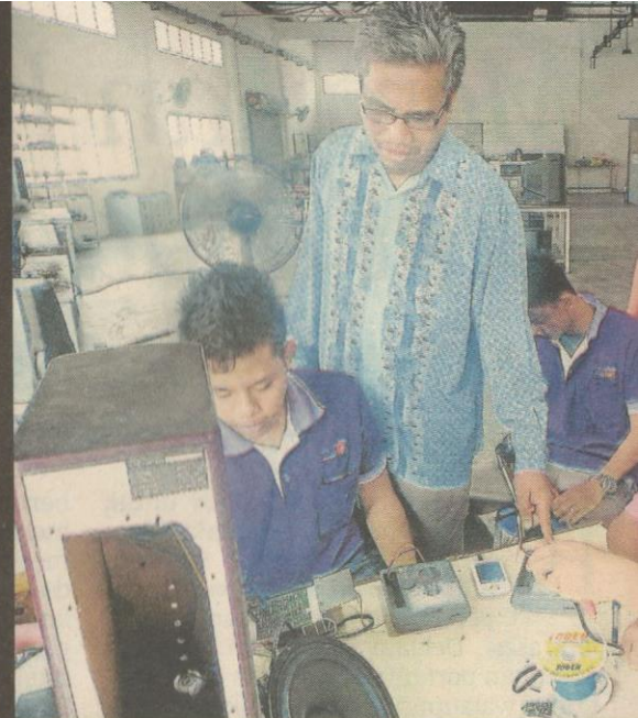
Pelatih didedahkan latihan elektrik dan elektronik