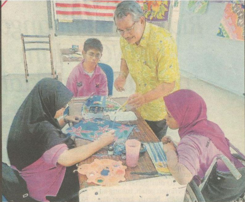
Bahrin bersama pelatih PLPP mencanting batik.