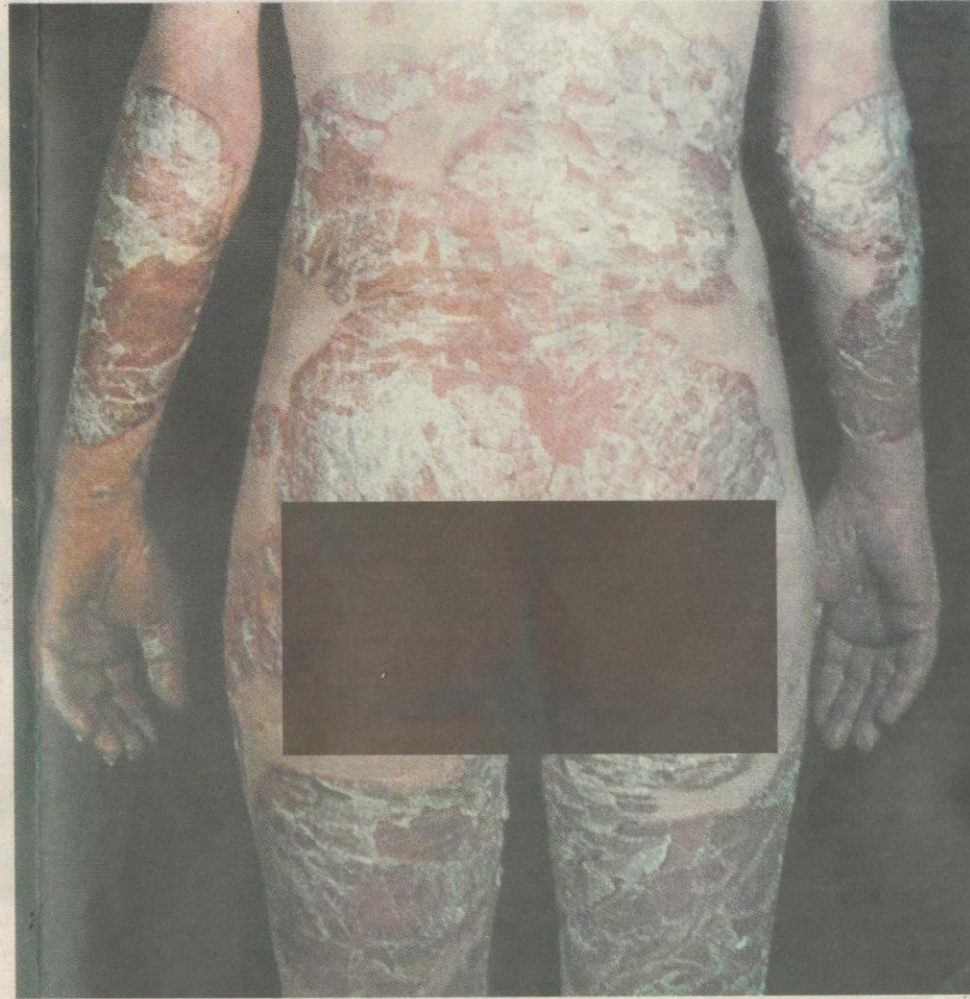
GANGGUAN FIZIKAL... kulit berwarna merah menggelupas sebelum menjadi kepingan berwarna putih keperangan.

Faktor yang boleh mencetuskan penyakit ini termasuk kecederaan atau infeksi yang mungkin bertindak dengan beberapa gen, atau corak keturunan spesifik gen, seterusnya bertindak balas menyebabkan psoriasis.