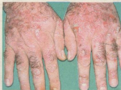
PESAKIT hepatitis menunjukkan tanda jangkitan melalui fizikal.

Hepatitis terbahagi kepada lima jenis iaitu hepatitis A, B, C, D dan E. Penyakit ini dapat dicegah dengan kesedaran dan suntikan vaksin.