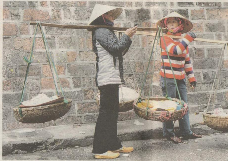
HEPATITIS A boleh berjangkit melalui makanan yang tercemar.

Secara amnya, hepatitis bermaksud radang hati. Apa-apa sahaja yang boleh