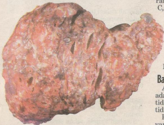
SEL-SEL hati menjadi rosak apabila terdedah kepada bahan toksik.

Vaksin hepatitis A boleh memberi perlindungan selama 12 bulan bagi dos yang diambil pertama kali dan 10 tahun selepas dos yang kedua.