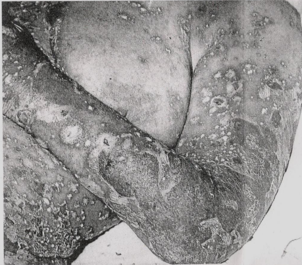
KES TERUK... jangkitan psoriasis merebak ke seluruh badan.