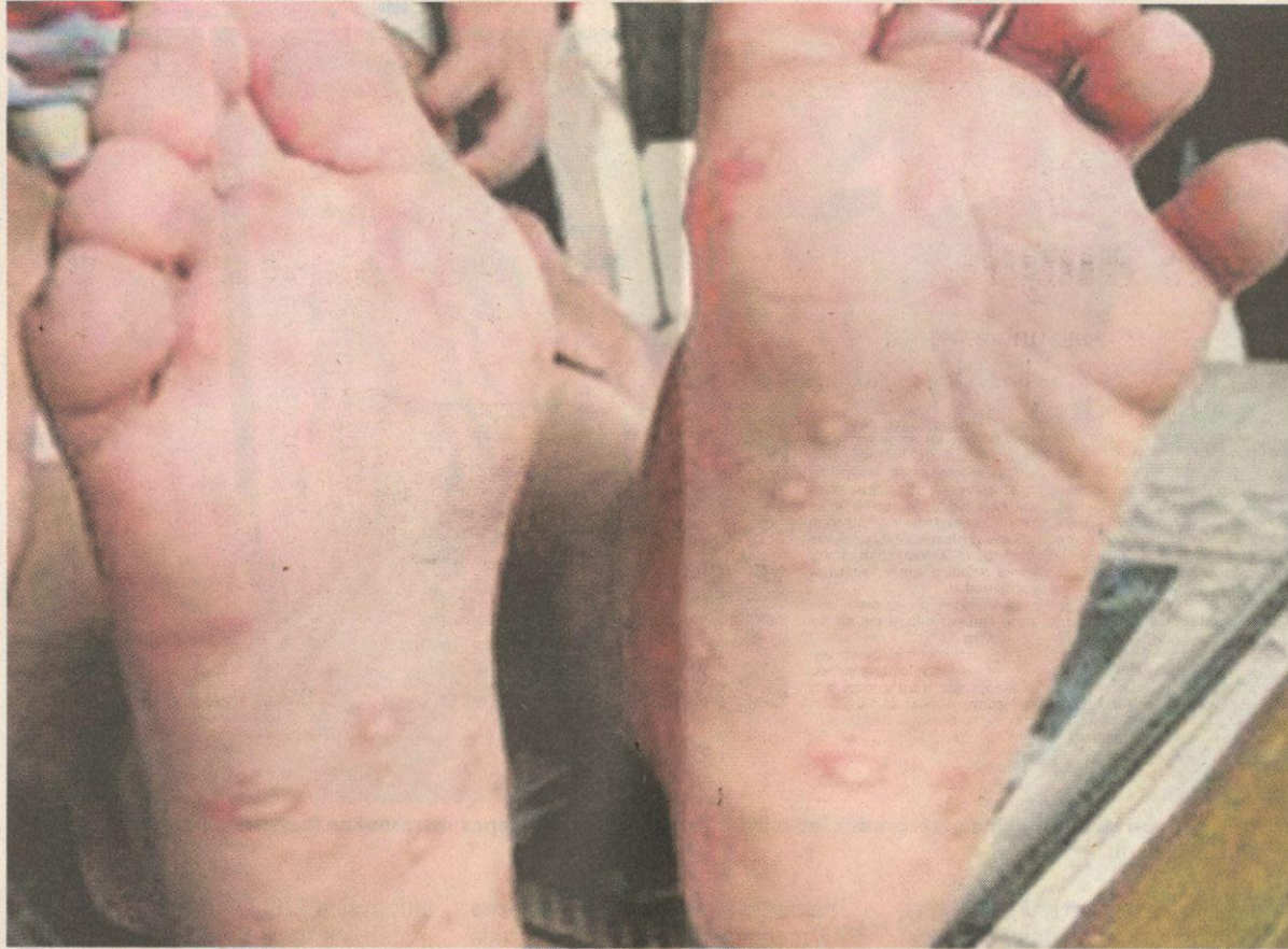
SEGERA bawa anak dapatkan rawatan jika ada tanda tapak kaki melepuh.