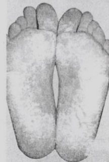
PENYAKIT ini boleh menjadi teruk dengan tanda kemerahan-merah yang melampau.

■ Stres atau tekanan, jangkitan kuman serta sesetengah jenis ubat-ubatan seperti beta blockers dan ubat malaria boleh menyebabkan penyakit ini bertambah teruk.