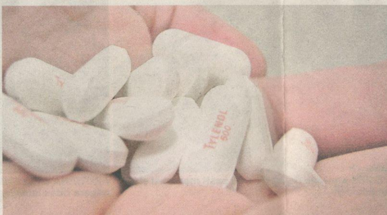
UBAT palsu dalam bentuk tablet menyukarkan lagi pengguna untuk mengesan ketulenannya.

Pertubuhan Kesihatan Sedunia (WHO) mentakrifkan pemalsuan ubat sebagai menyembunyikan identiti atau sumber ubat bagi menjadikan ia kelihatan tulen.